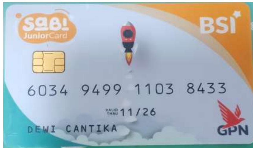
Gambar 4.2 Tampak Depan Desain ATM Tabungan Junior