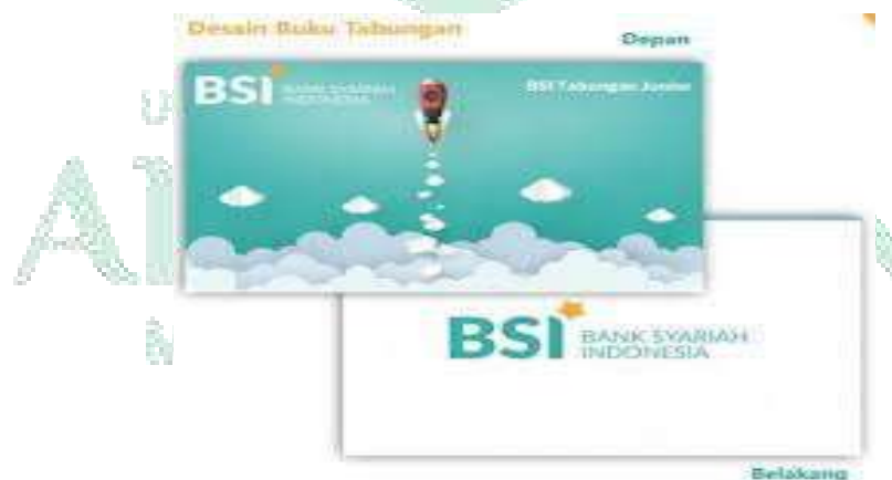
Gambar 4.1 Desain Buku Tabungan Junior Bank Syariah Indonesia (BSI)

“bukti fisik yang diberikan adalah Buku Tabungan dan Kartu debit/ATMGPN dengan buku tabungan atas nama anak. Dimana sebelumnya di Bank BNI Syariah kartu ATM nya tanpa nama sehingga dapat dikatakan bahwa dengan adanya BSI, Tabungan Junior semakin meningkat karena kartu ATM nya sudah dilengkapi nama dan tentunya lebih bagus dari sebelumnya. Terdapat pula layanan e-channel (BSI mobile, net banking dan SMS banking) serta kartu debit/ATM GPN yang bisa dipergunakan di seluruh ATM maupun EDC di seluruh Indonesia. Berikut ini adalah contoh desain buku tabungan dan kartu ATM Tabungan Junior.”