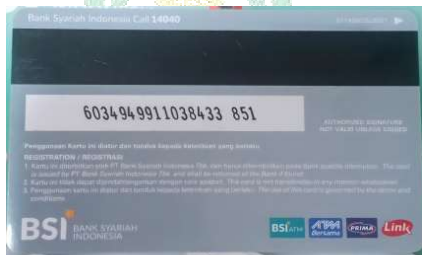
Gambar 4.3 Tampak Belakang Desain ATM Tabungan Junior