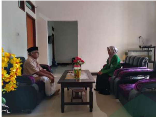
Wawancara dengan ketua yayasan