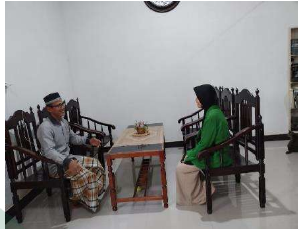
Wawancara dengan Ka. Pondok