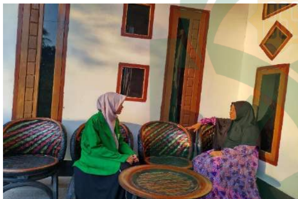
Wawancara dengan asatidz