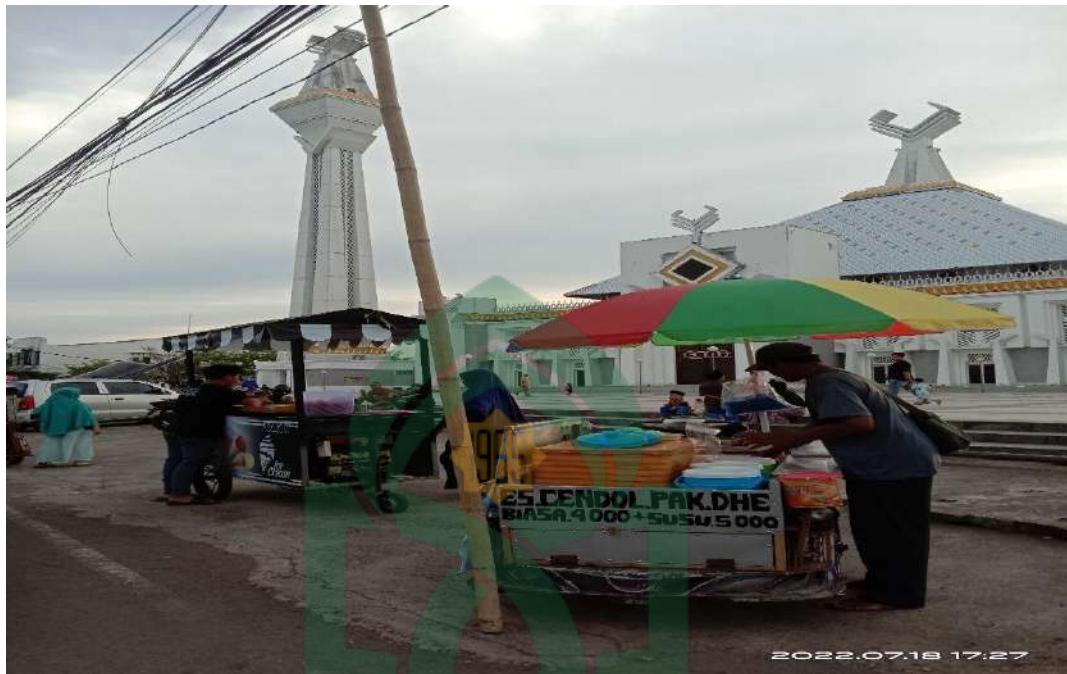
Gambar 5: Gambaran PKL di pelataran mesjid Syekh Yusuf