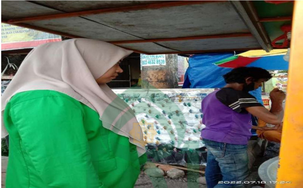
Gambar 3: Wawancara terhadap penjual Cimol