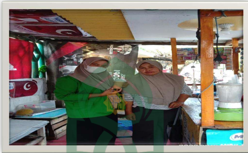
Gambar 1: Wawancara terhadap penjual Minuman Pop Ice