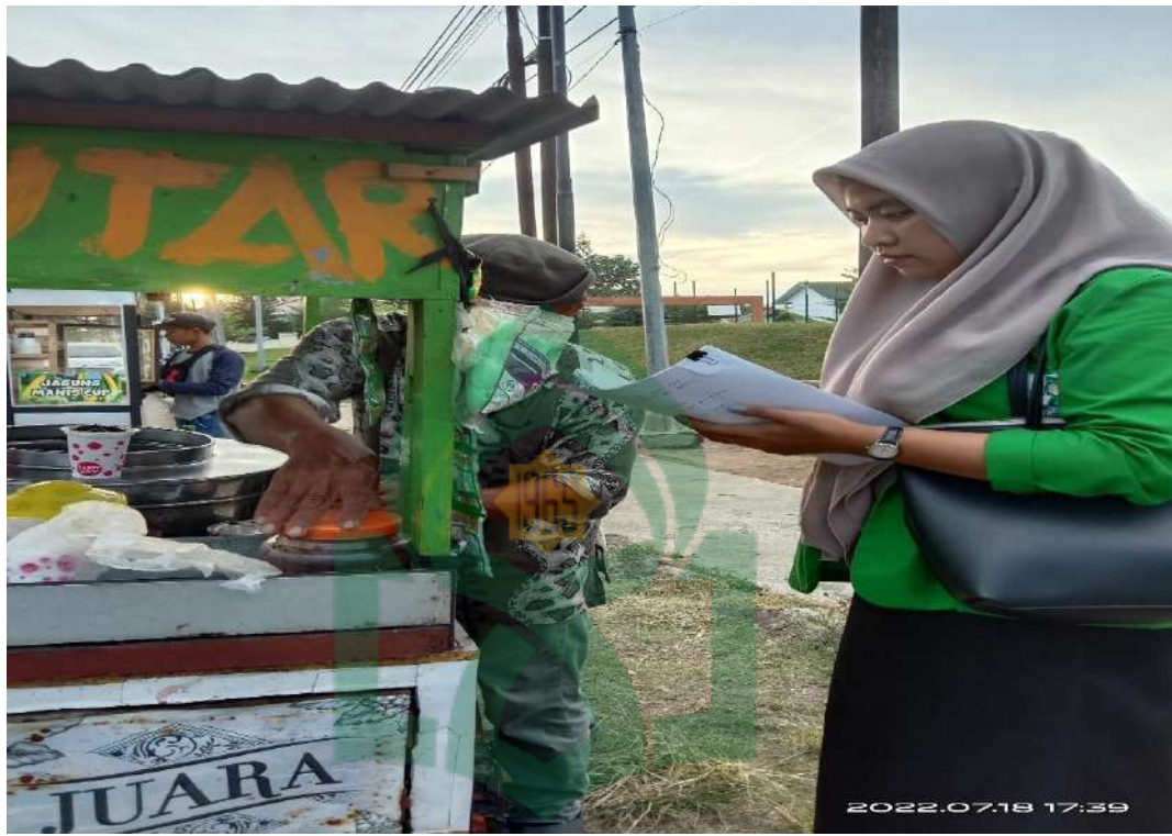
Gambar 9: Wawancara terhadap penjual Es Putar