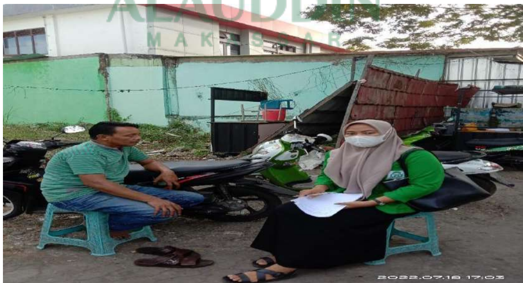
Gambar 10: Wawancara terhadap penanggung jawab PKL lapangan syekh yusuf