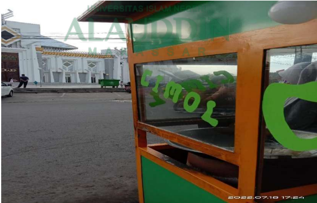
Gambar 4: Proses penggorengan cimol