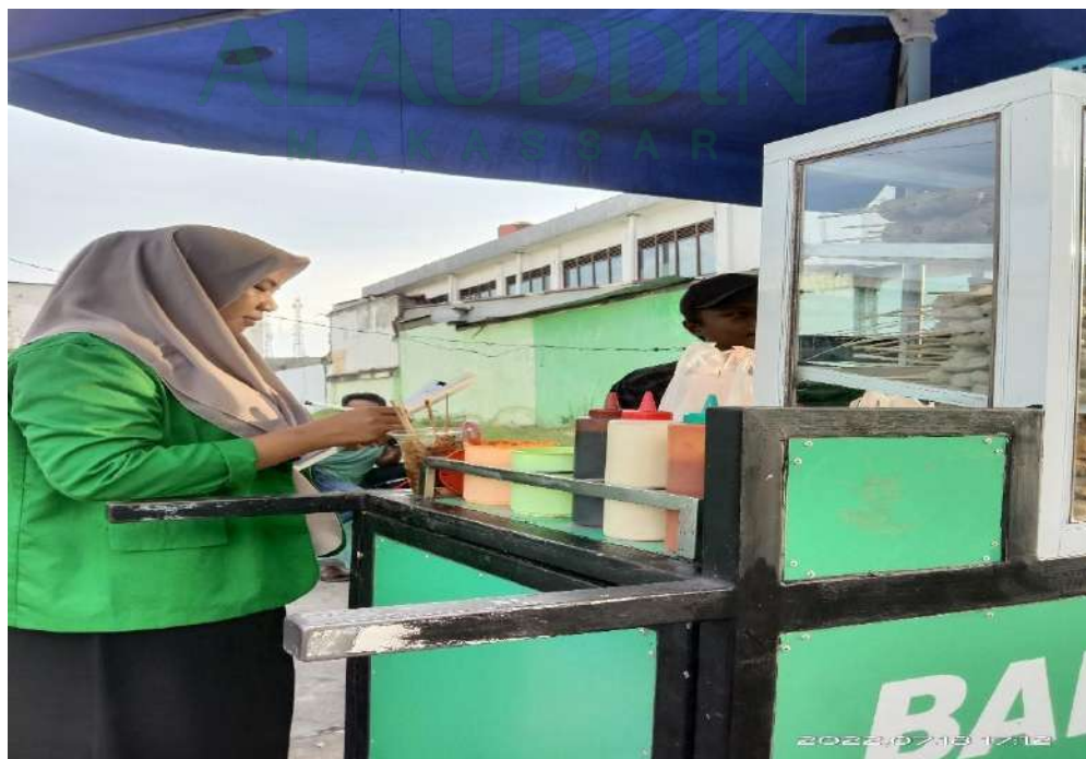
Gambar 2: Wawancara terhadap penjual Bakso Goreng