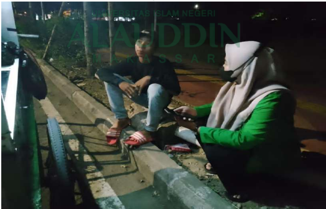
Gambar 8: Wawancara terhadap Penjual Burger