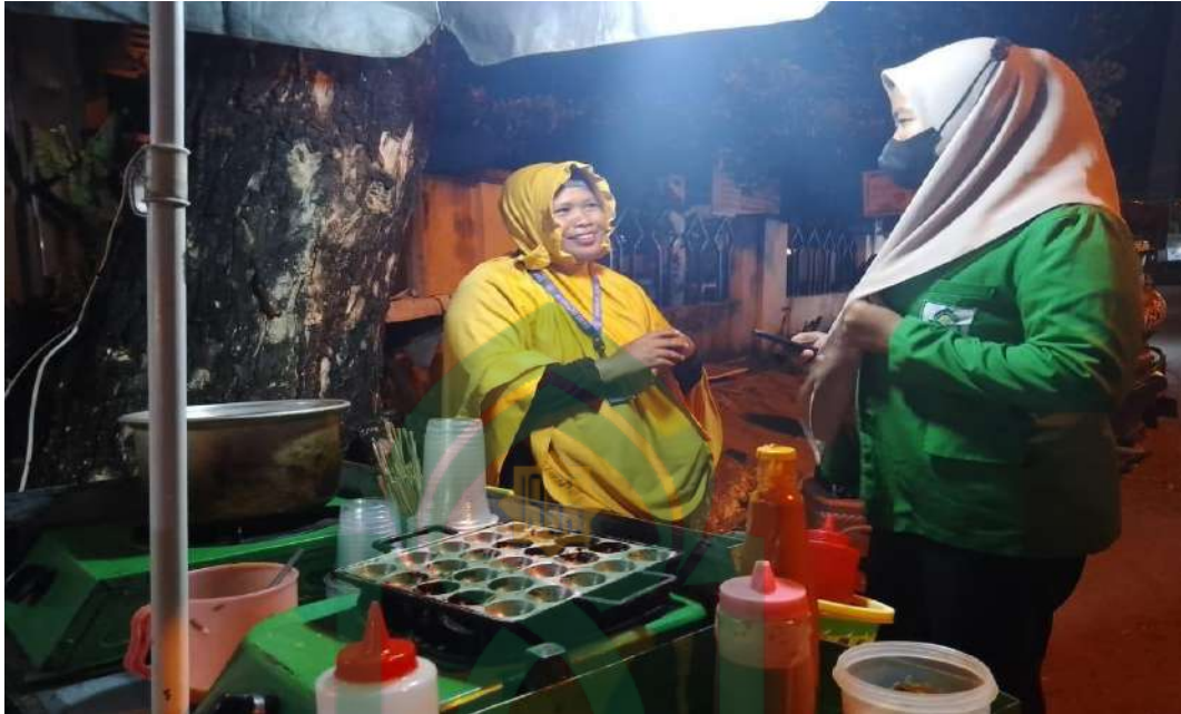
Gambar 7: Wawancara terhadap penjual makanan Pentol