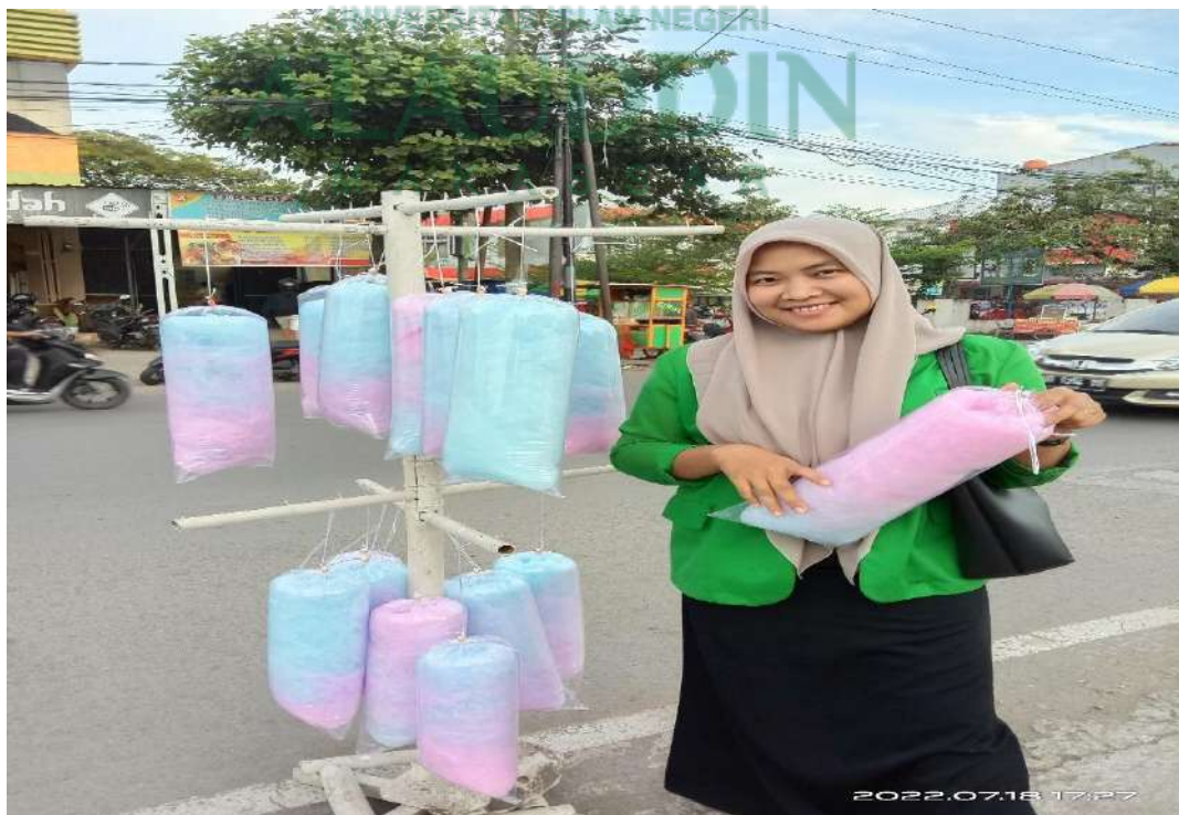
Gambar 6: Produk Makanan Gulali