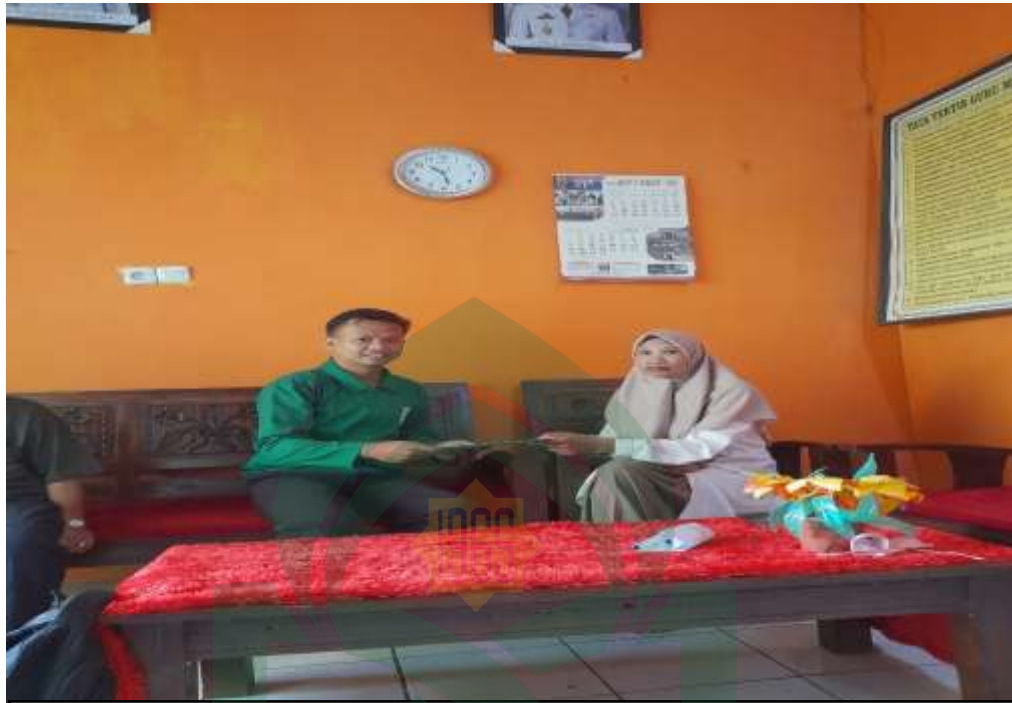
Gambar 5: Penyerahan surat izin penelitian kepada Kepala MTs Muhammadiyah Ereng-Ereng.