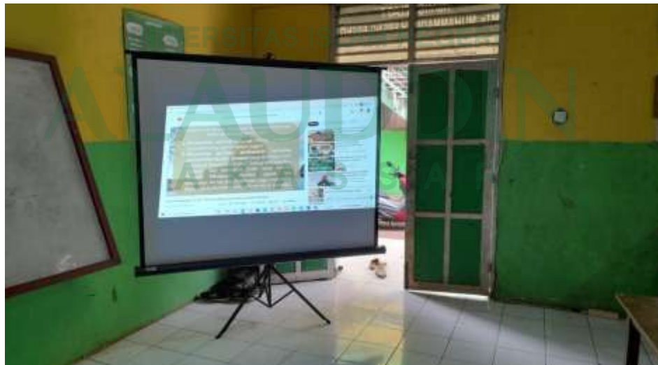
Gambar 2: Penggunaan Movie Learning dalam Pembelajaran.