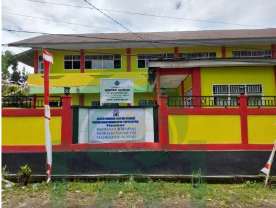
Gambar 1: Lokasi Penelitian, MTs. Muhammadiyah Ereng-Ereng.