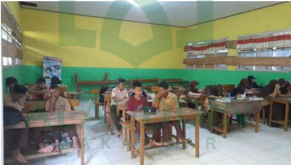
Gambar 5: Proses pembelajaran.