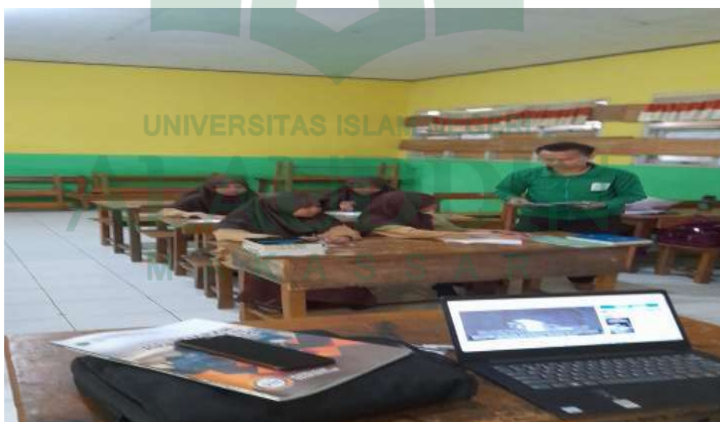
Gambar 6: Pemberian Angket.