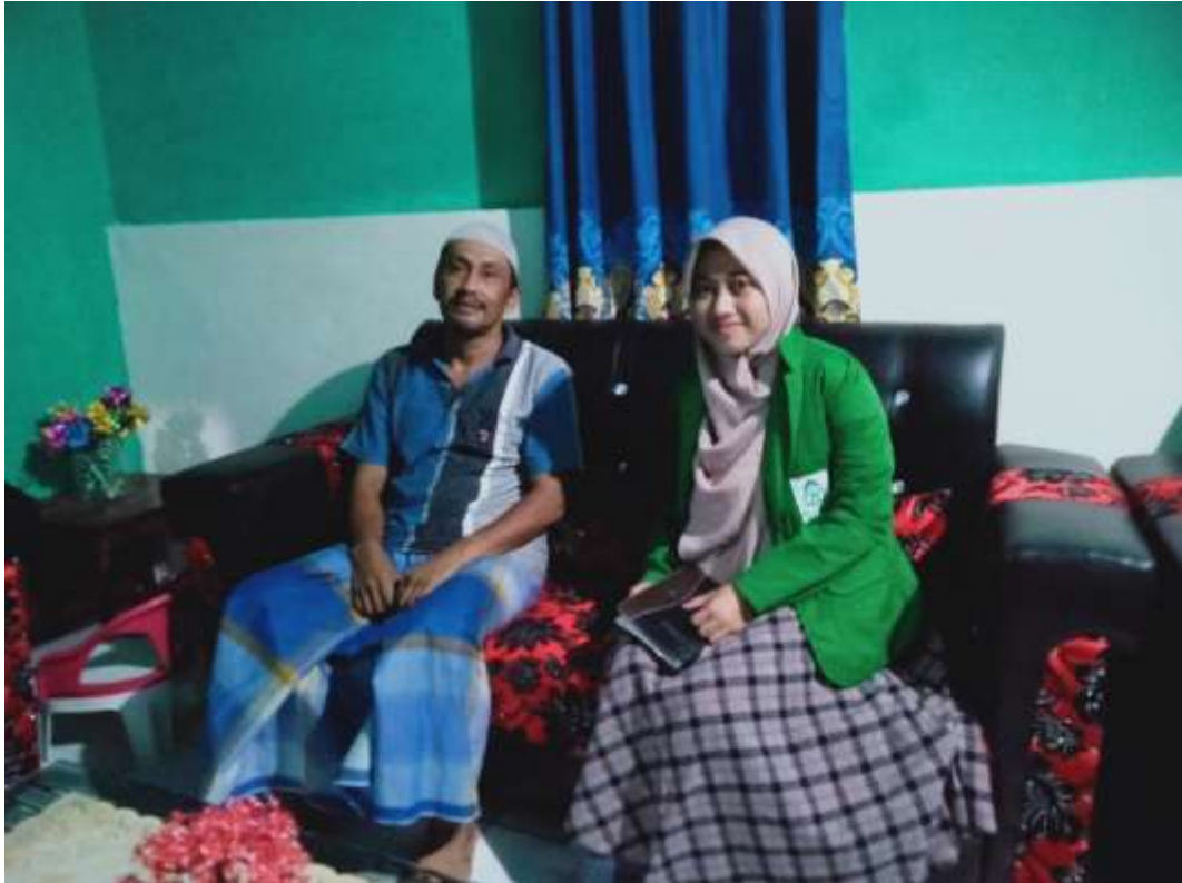
Foto Bersama Dengan Narasumber dan Surat Izin Penelitian