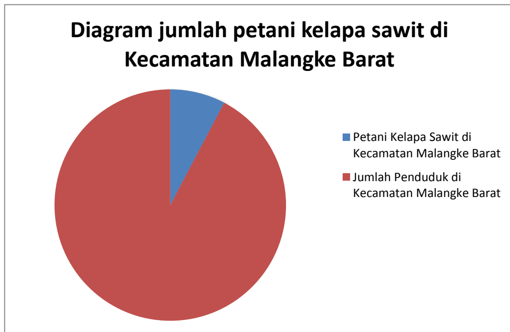
Diagram 4.1 Jumlah petani kelapa sawit di Kecamatan Malangke Barat.

Sumber data : data dari kantor Kecamatan Malangke Barat, Desember 2023