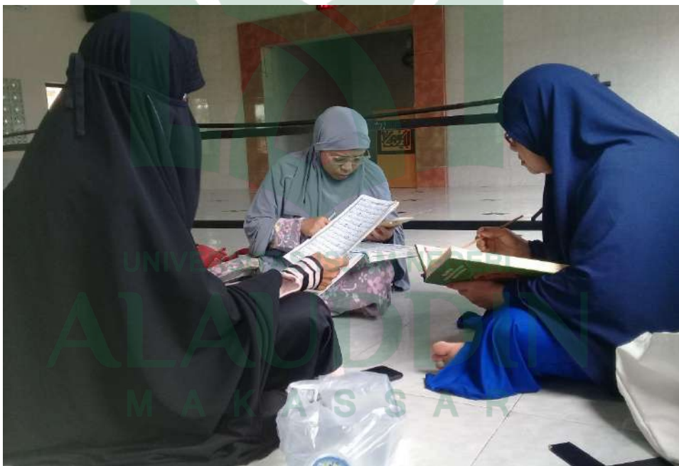
Tanggal: 04 Februari 2021

Peneliti melakukan observasi pada penerapan Metode Dirosa di Dusun Raja-Raja Desa Bunga Ejaya Kecamatan Pallangga Kabupaten Gowa