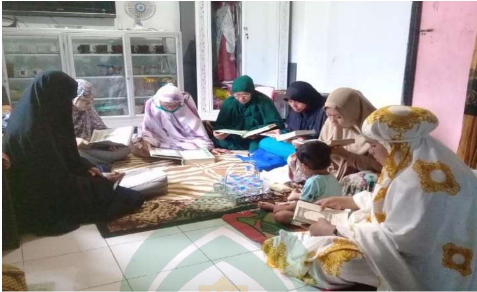
Tanggal 02 Februari 2021