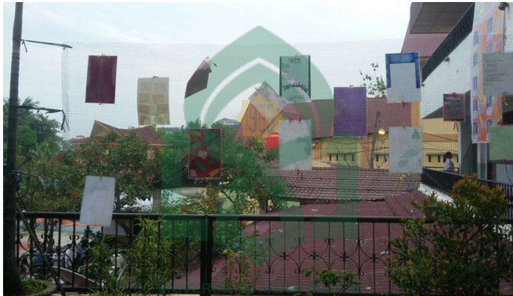
Gambar 5.3 : Jemuran Literasi