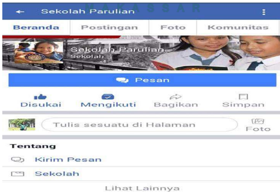
Gambar 5.4 : Halaman Facebook Sekolah Parulian