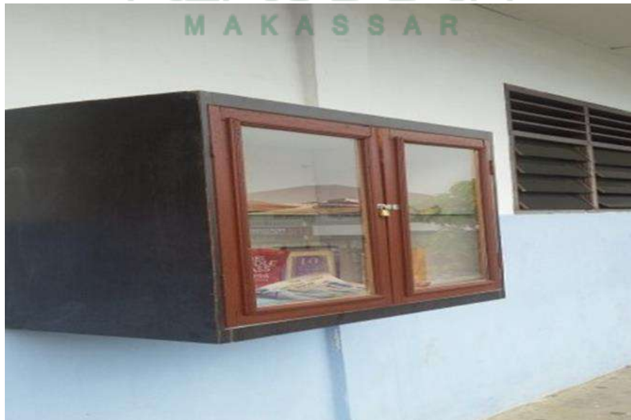
Gambar 5.2 : Lemari Buku Yang Ditampilkan di Lorong Kelas