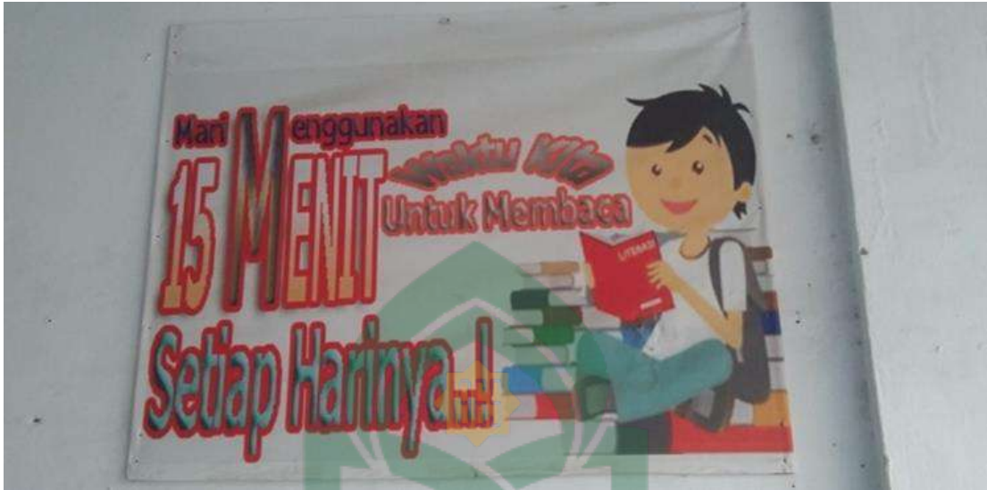
Gambar 5.5 : Poster Untuk Mengajak Siswa Giat Berliterasi