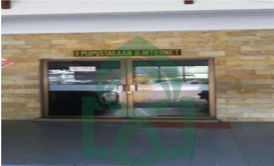
Gambar 5.1 : Persutakaan Sekolah