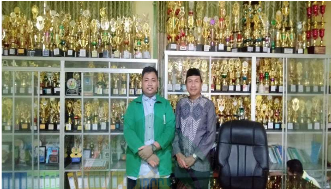
Kepala Madrasah MAN Jeneponto