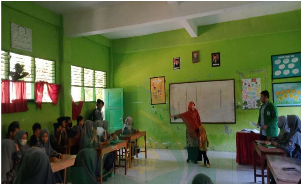
Suasana proses belajar SKI di MAN Jenepono Sekaligus observasi awal