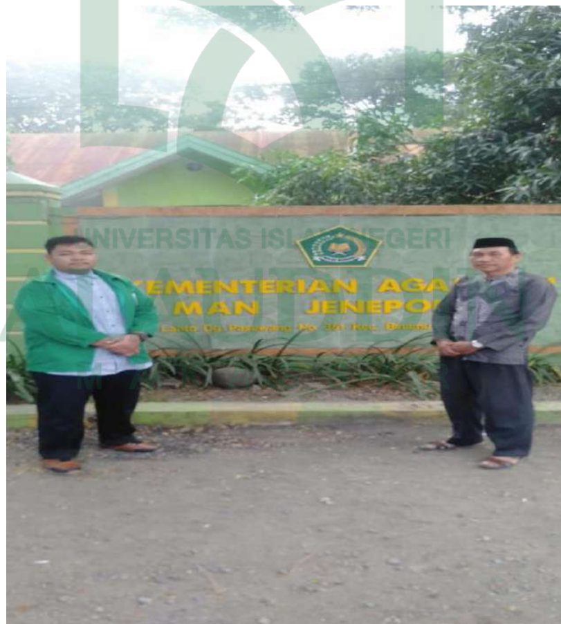
Lokasi MAN Jeneponto