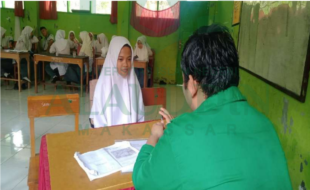
Wawancara peserta didik kelas X 3