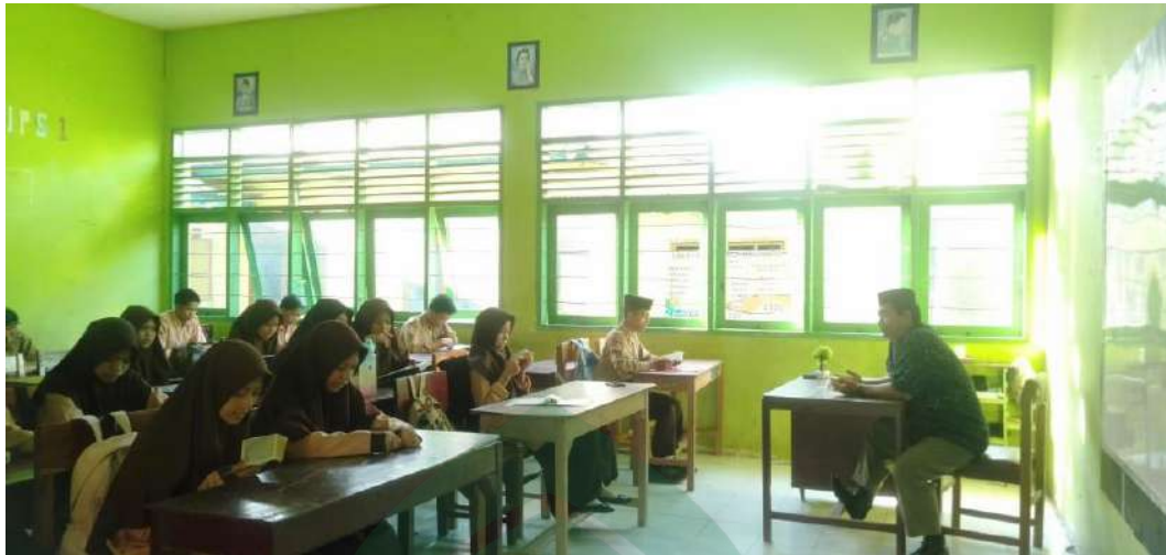
Suasana Tadarrus Al-qur'an yang di pimpin oleh wali kelas Sebelum Memulai Pembelajaran