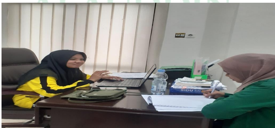
Gambar 3 Wawancara dengan Hakim Pengadilan Agama Bulukumba Kelas I B