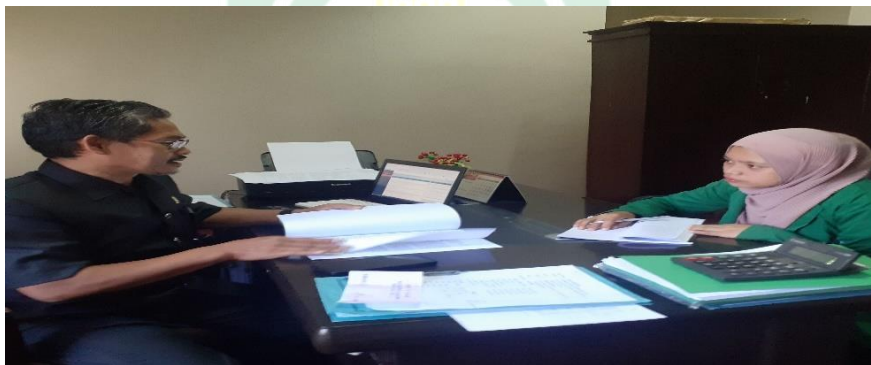
Gambar 2 Wawancara dengan Panitera Pengadilan Agama Bulukumba Kelas I B