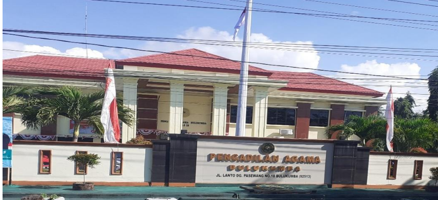
Gambar 1 Lokasi Penelitian Pengadilan Agama Bulukumba Kelas I B