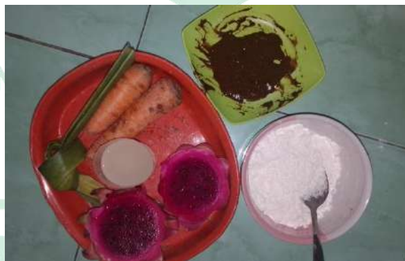
Gambar 2. 1 Bahan kue mochi pelangi. 17

Mochi pelangi merupakan salah satu jenis kue dengan beraneka macam jenis warna yang terbuat dari tepung beras ketan, bertekstur kenyal berbentuk bulat dan dilumuri tepung maizena yang telah disangrai. Adapun alat yang digunakan pada pembuatan mochi pelangi ialah sendok, piring plastik, spatula, talenan, wadah. Kemudian bahan yang digunakan adalah tepun ketan, tepun yang telah disangrai, susu full cream , gula pasir, garam, air secukupnya, coklat batang yang dilelehkan, buah naga, wortel dan pandan.