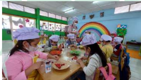
Gambar 2. 2 Proses pembuatan mochi pelangi. 23

Pendidikan Anak Usia Dini bahwa pengembangan kecakapan hidup dilakukan secara terpadu baik melalui pembelajaran untuk mengembangkan pengetahuan dan keterampilan maupun melalui pembiasaan dan keteladanan. 22