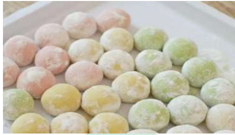
Gambar 2. 3 Hasil kegiatan pembuatan mochi pelangi. 24