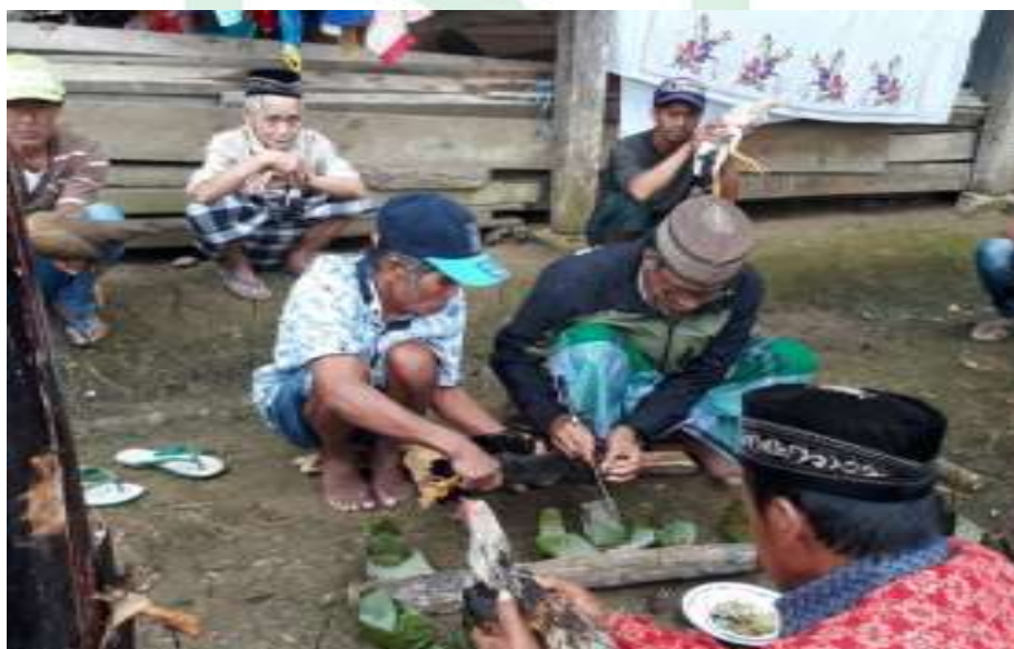
Gambar 10. Proses Pematongan Ayam