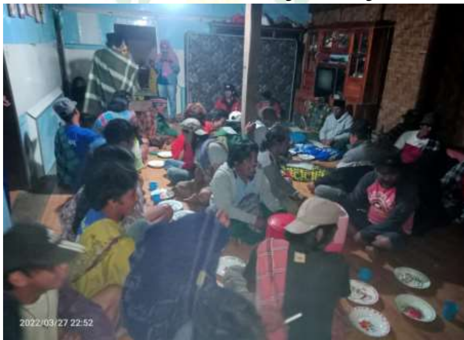
Gambar 12. Proses Mangduangan