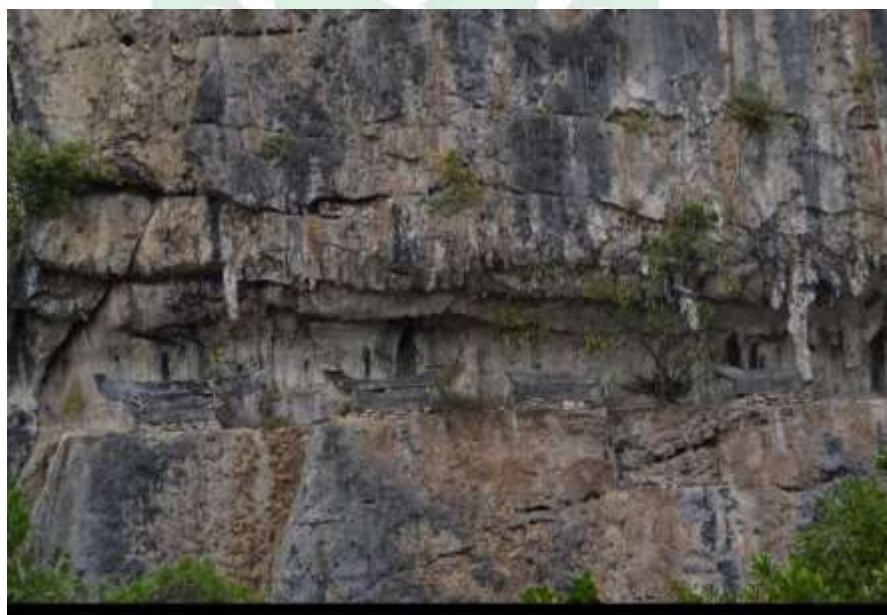
Gambar 6. Tebing Mandu