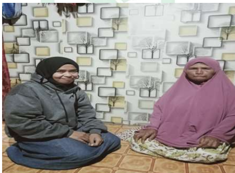
Gambar 4. Riama (masyarakat)