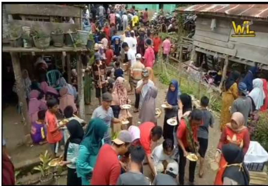
Gambar 9. Makan Bersama