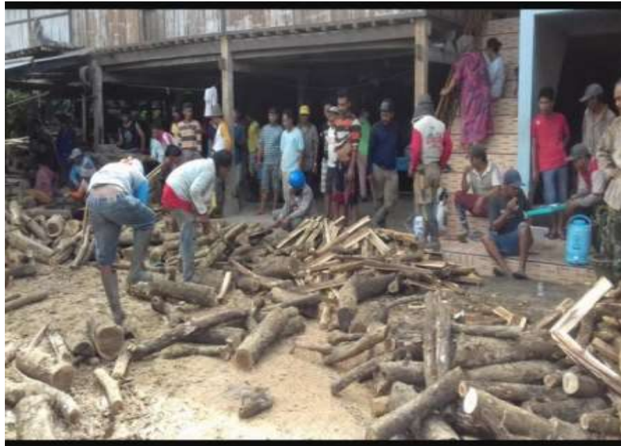
Gambar 7. Proses Mekaju