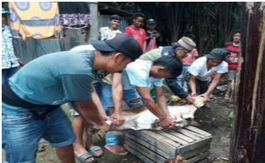
Gambar 11. Proses Pematangan Kambing