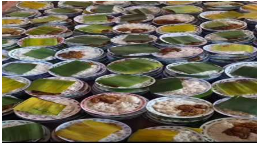
Gambar 8. Nasi Seribu