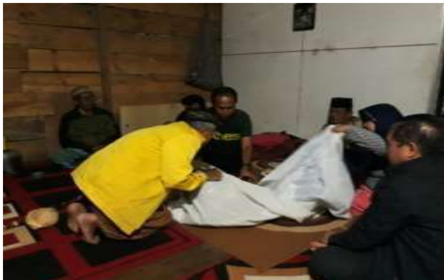
Gambar 13. Proses Mangpalao (menurunkan arwah)