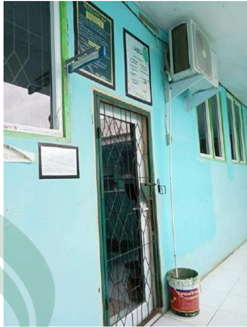
Musholla MTs Ash-Shalihin