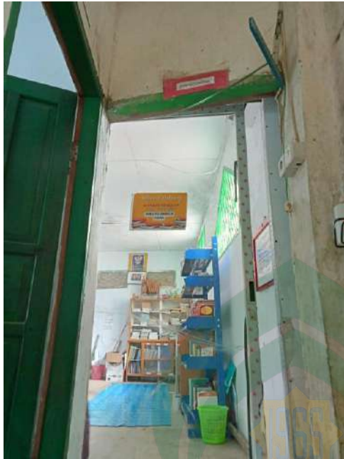
Perpustakaan Umum Ash-Shalihin