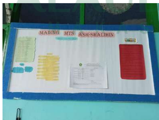
Mading MTs Ash-Shalihin