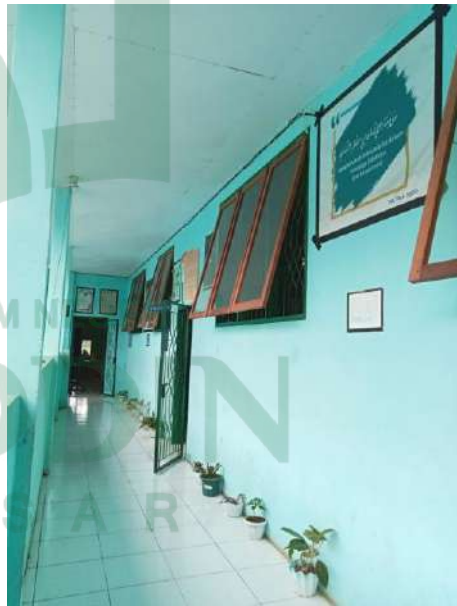
Suasana depan kelas MTs Ash-Shalihin