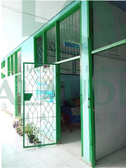
Depan Kantor MTs Ash-Shalihin