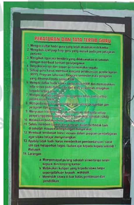
Peraturan dan tata tertib guru dan siswa