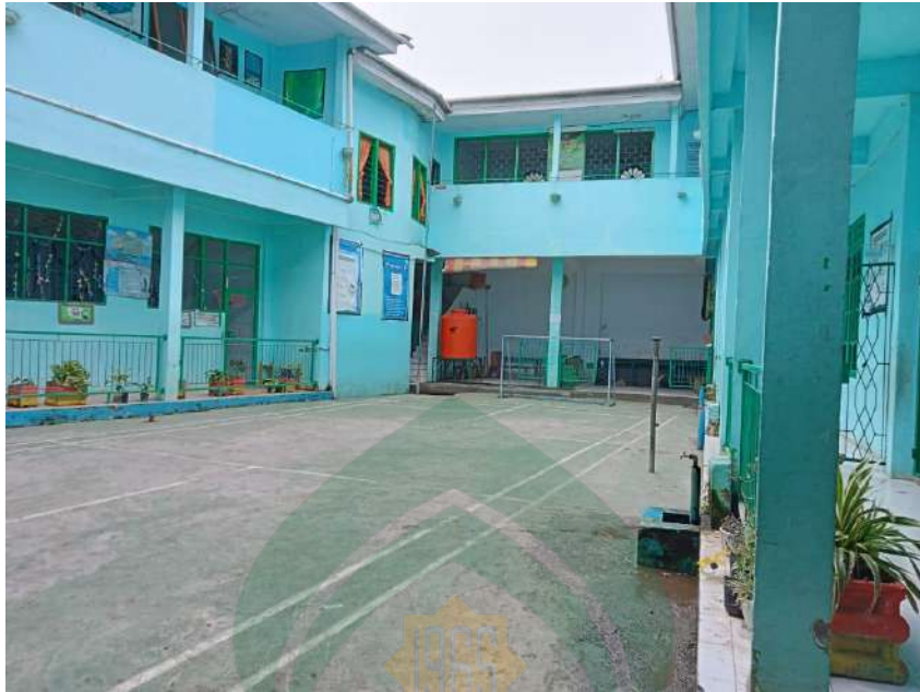
Suasana lingkungan madrasah Ash-Shalihin