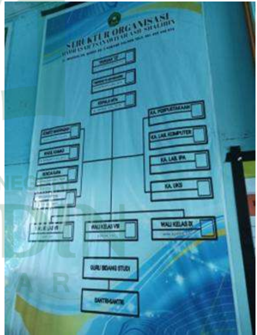
Struktur Organisasi MTs Ash-Shalihin