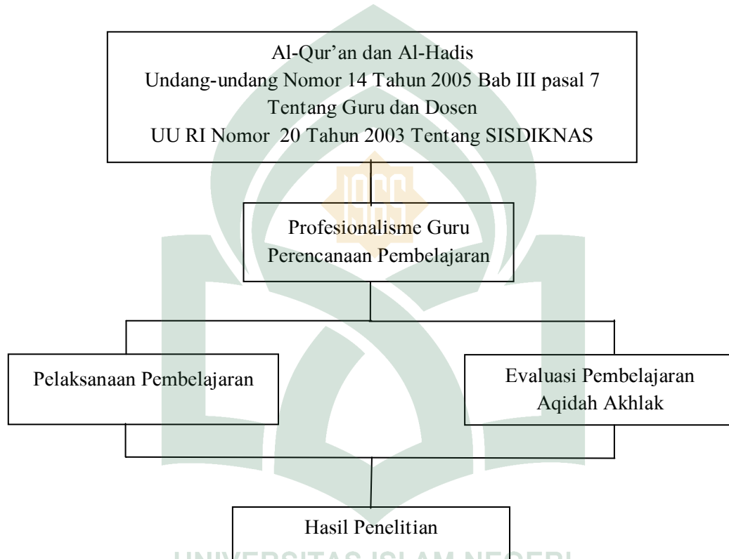
Gambar 1 : Skema Kerangka Pikir