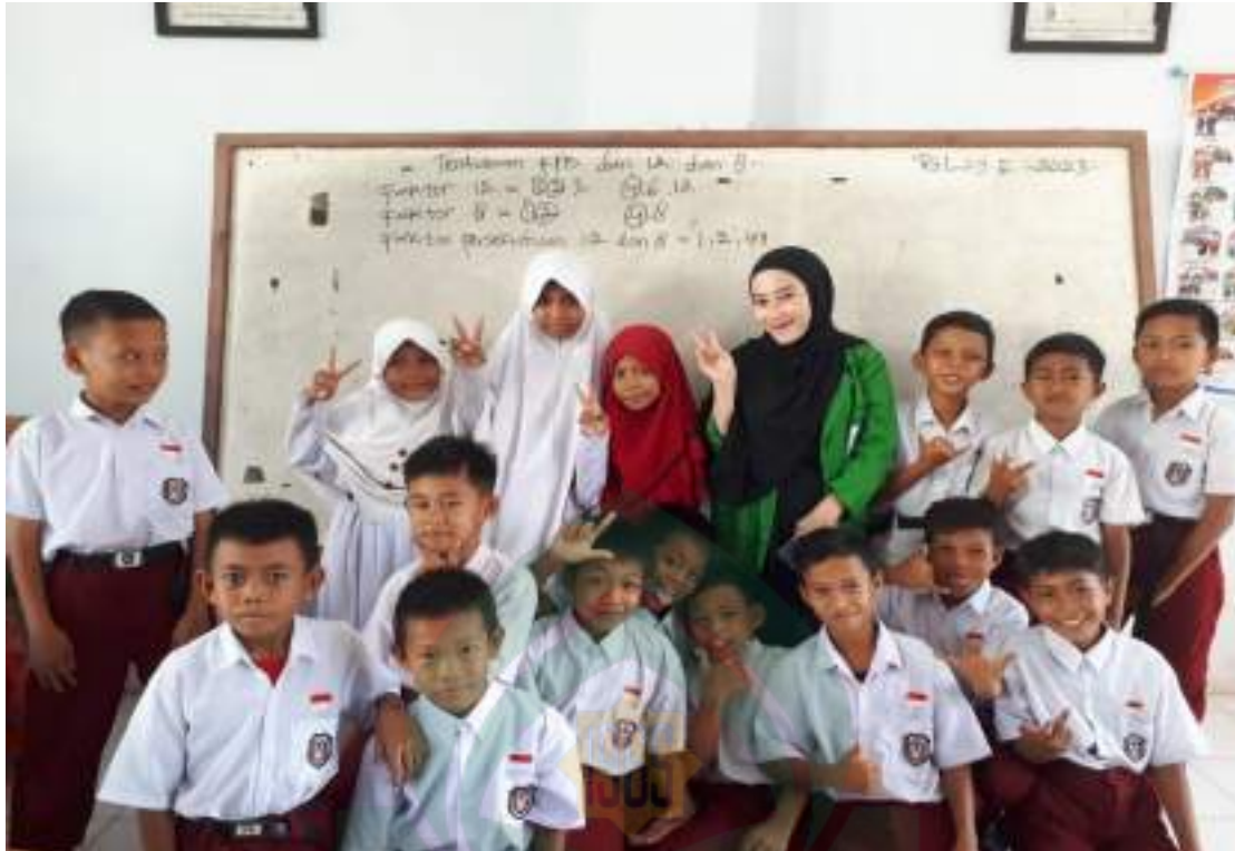
( Gambar 9. Foto Bersama Peserta Didik )