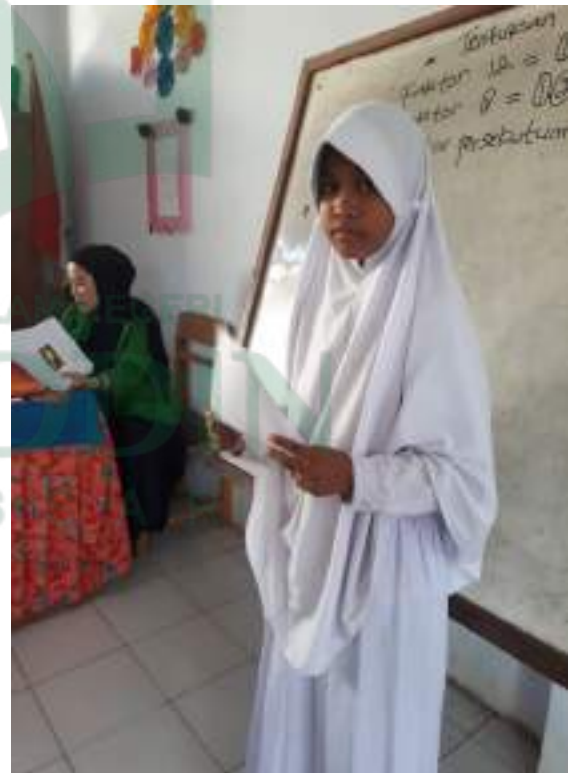
Gambar 8. Pembacaan Puisi