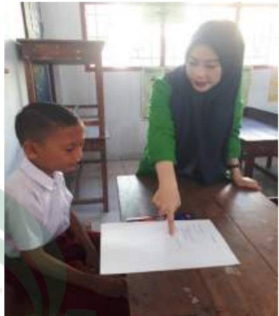
Gambar 2. Pembagian Soal Pretest