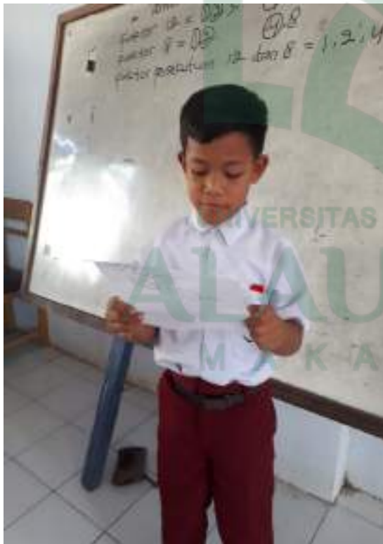
Gambar 7. Pembacaan Puisi