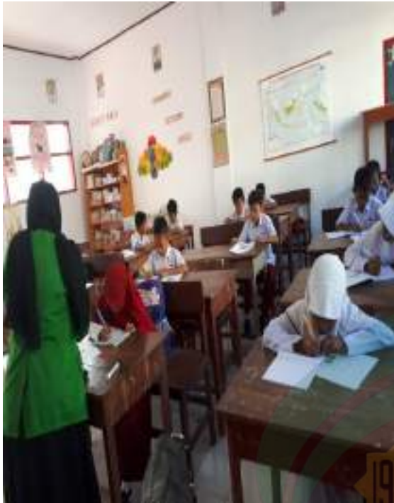
Gambar 5. Pembagian Soal Posttest