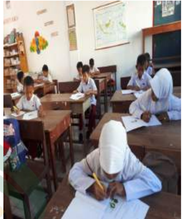
Gambar 6. Pengerjaan Soal Posttest