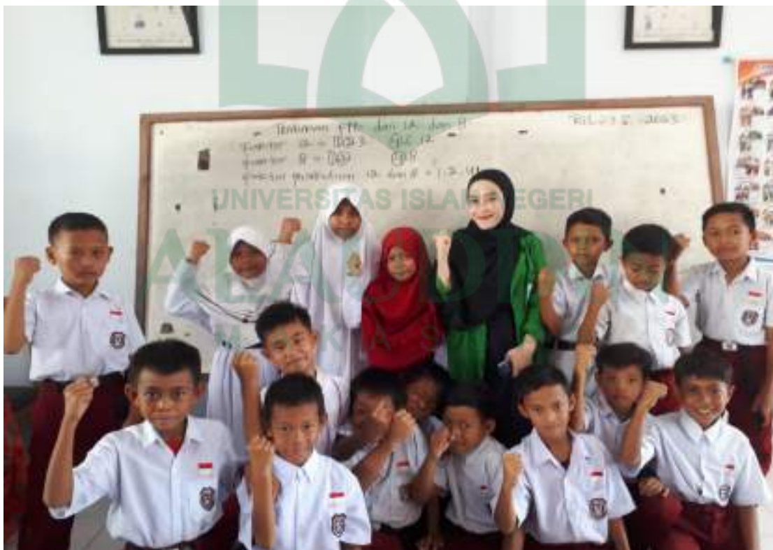
( Gambar 10. Foto Bersama Peserta Didik )