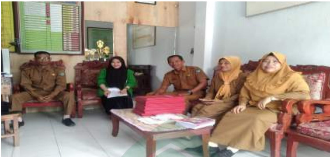
( Gambar 11. Foto Bersama Guru SD Negeri Moncobalang II )