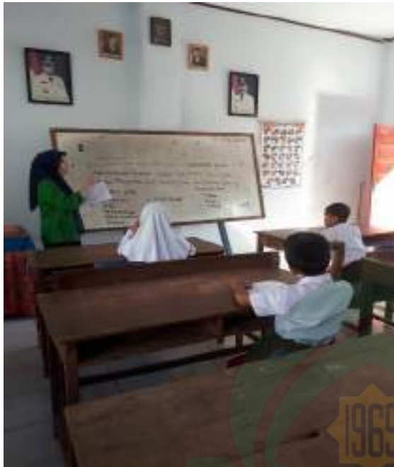
Gambar 1. Penerapan Materi Puisi