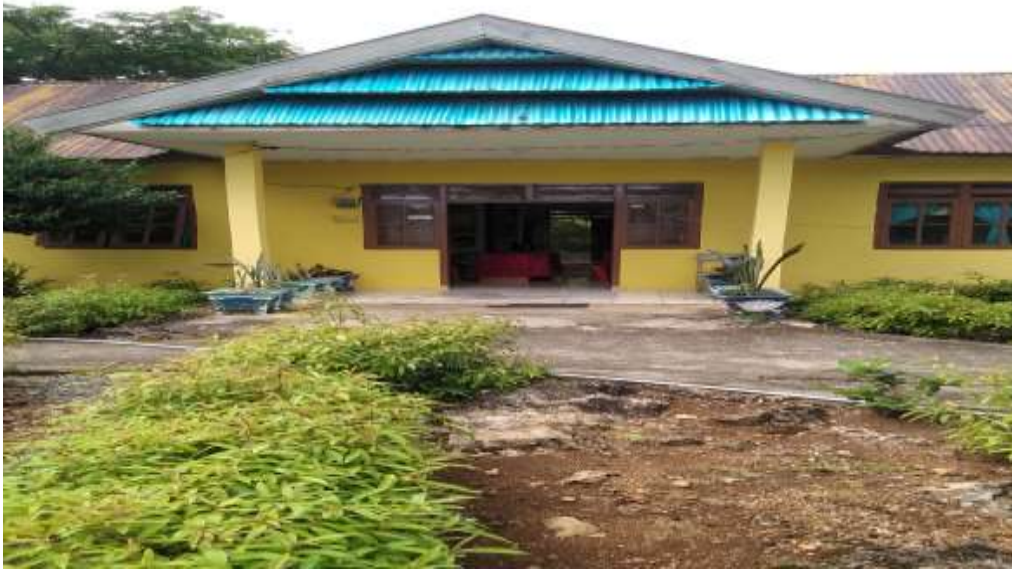
Gambar 1.1: Dokumentasi Kantor Desa Bontona Saluk Kecamatan Bontomatene Kabupaten Selayar Tanggal 25 Februari 2021