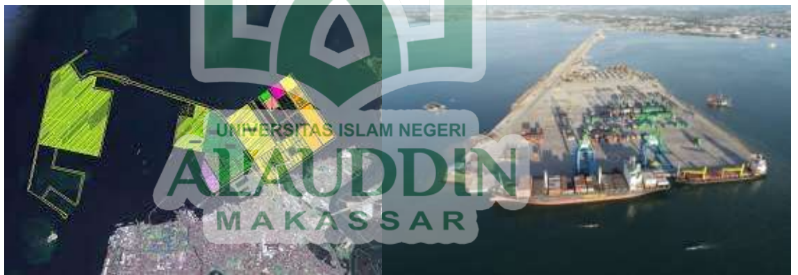
Gambar 4.2 Peta Lokasi Proyek Makassar New Port PT Pembangunan Perumahan (Persero) Tbk

Pembangunan proyek Makassar New Port Tahap I ini terdiri beberapa paket, yaitu: