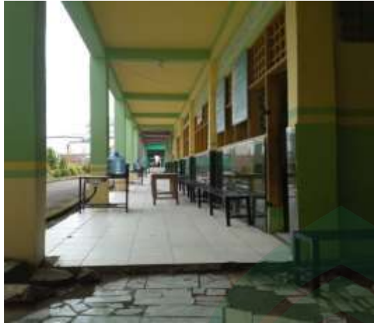
Gambar 10. Depan kelas MTs