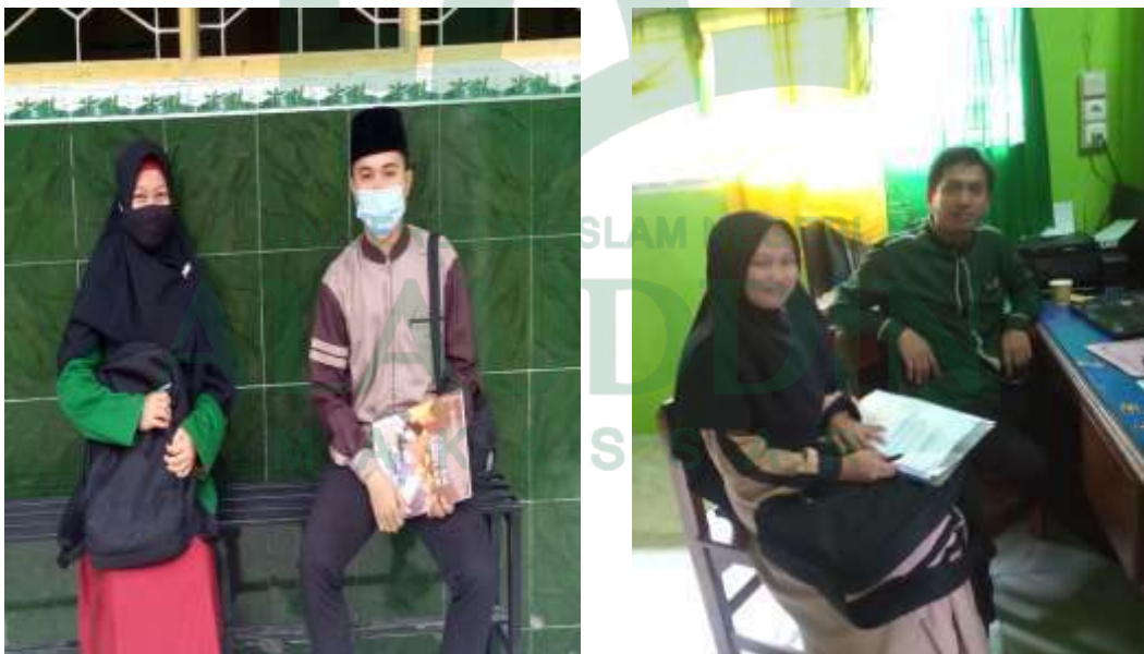
Gambar 7. Wawancara dengan guru akidah akhlak