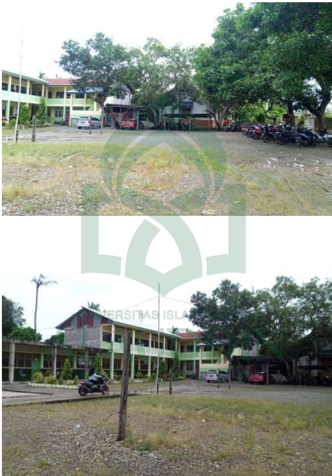
Gambar 17. Gedung Sekolah As'Adiyah Lancirang