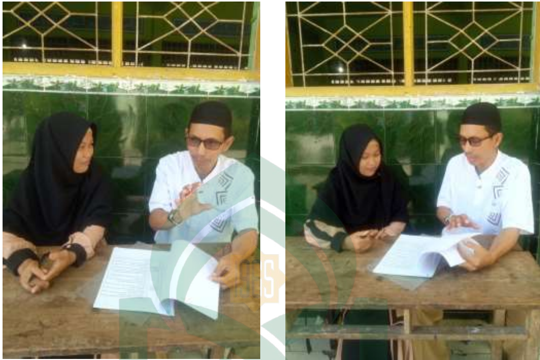
Gambar 8. Wawancara dengan guru qur'an hadits