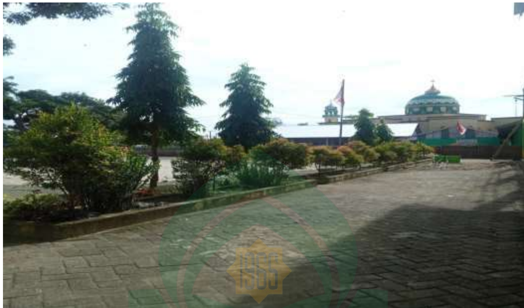
Gambar 16. Depan Gedung Sekolah.