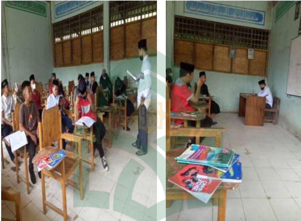
Gambar 5. Proses Pembelajaran di Kelas VIII A UNIVERSITAS ISLAM NEGERI