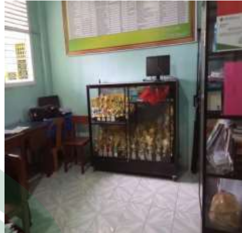
Gambar 11. Ruang TU