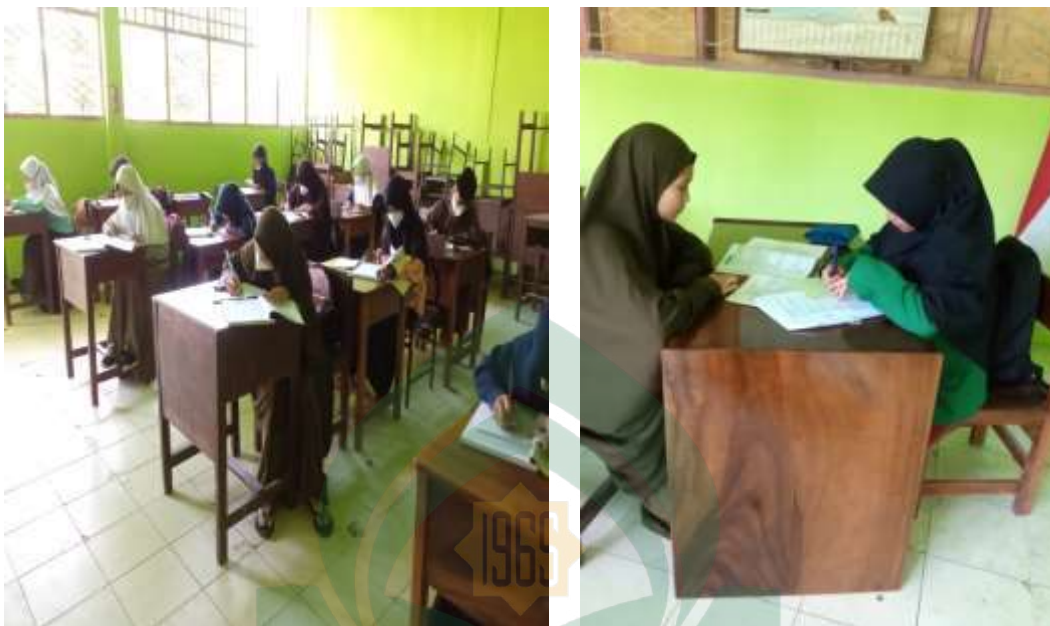
Gambar 6. Proses Pembelajaran di Kelas VIII B