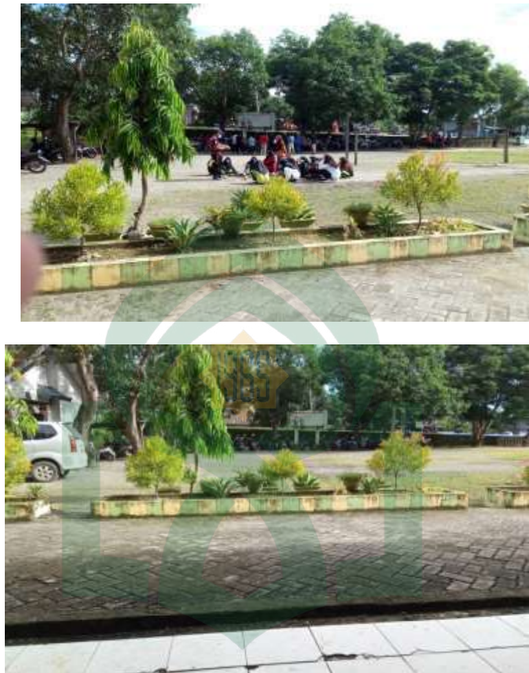
Gambar 17. Halaman sekolah, tempat upacara, olahraga dan tempat parkir

UNIVERSITAS ISLAM NEGERI ALAUDDIN M A K A S S A R