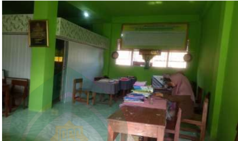
Gambar 13. Ruang Guru