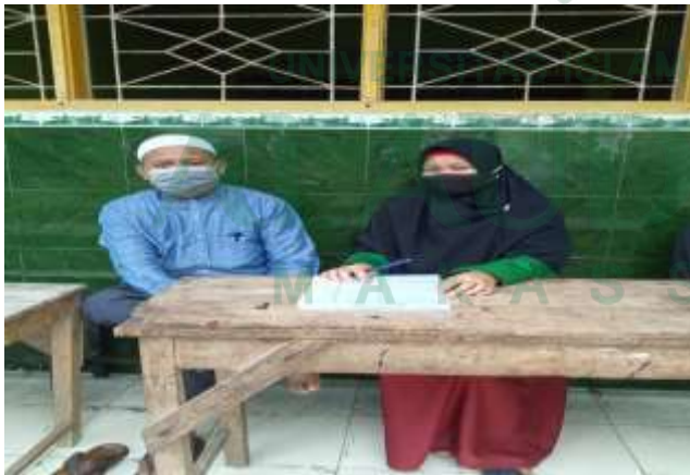
Gambar. 9. Wawancara dengan Kepala Sekolah