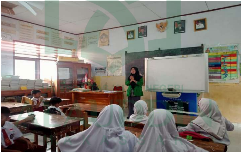
Gambar 2 Perkenalan