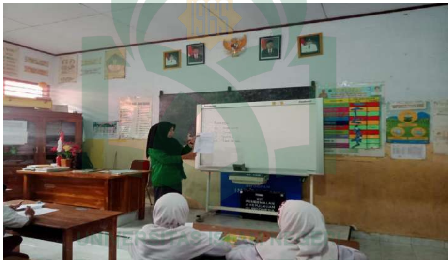
Gambar 4 Penjelasan Pengisian Kusioner