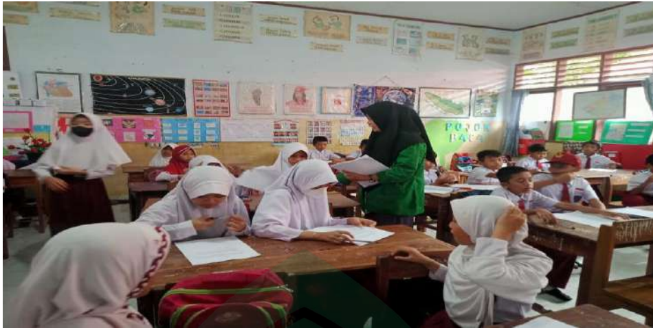
Gambar 3 Pemabagian Kuosioner