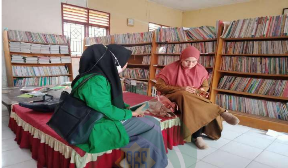
Gambar 1 Wawancara Guru PAI