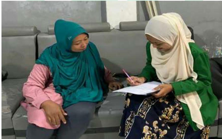
Dokumentasi bersama nasabah PNM Mekaar Syariah