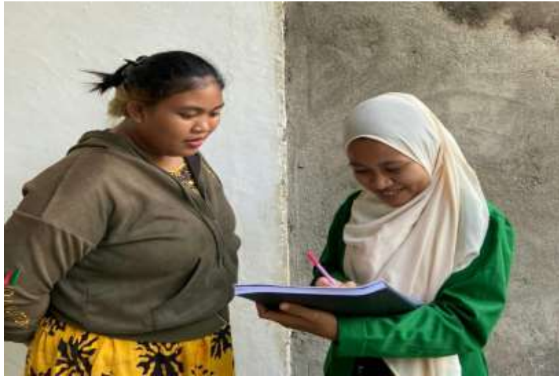
Dokumentasi bersama nasabah PNM Mekaar Syariah