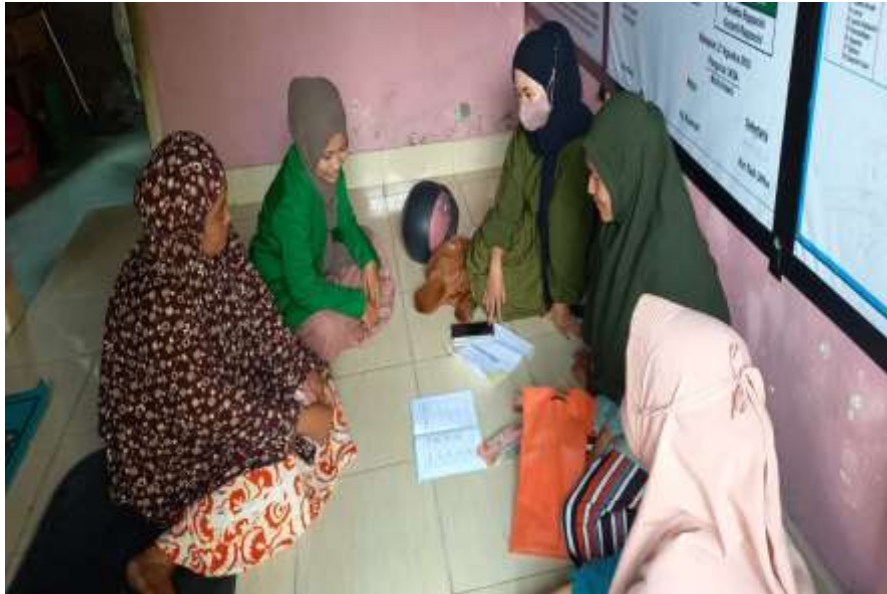
Dokumentasi bersama Kepala Cabang PNM dan para nasabah PNM Mekaar Syariah