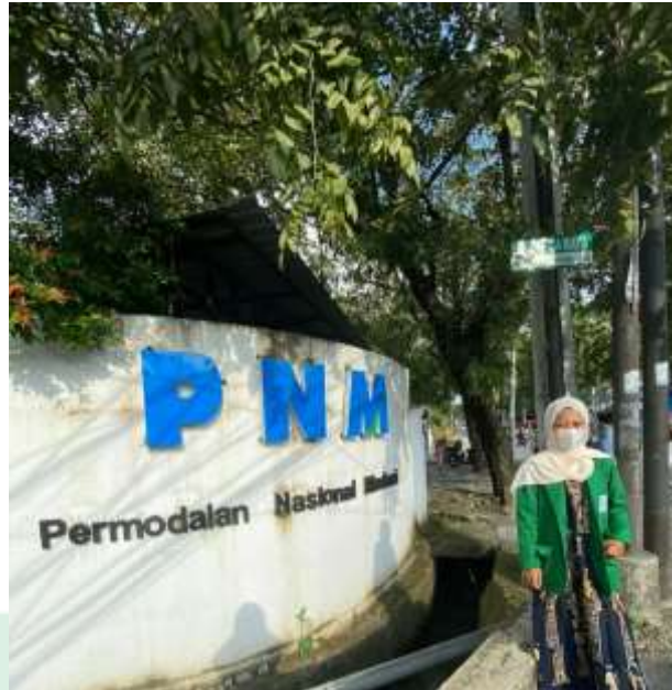
Dokumentasi di kantor PNM Mekaar Syariah