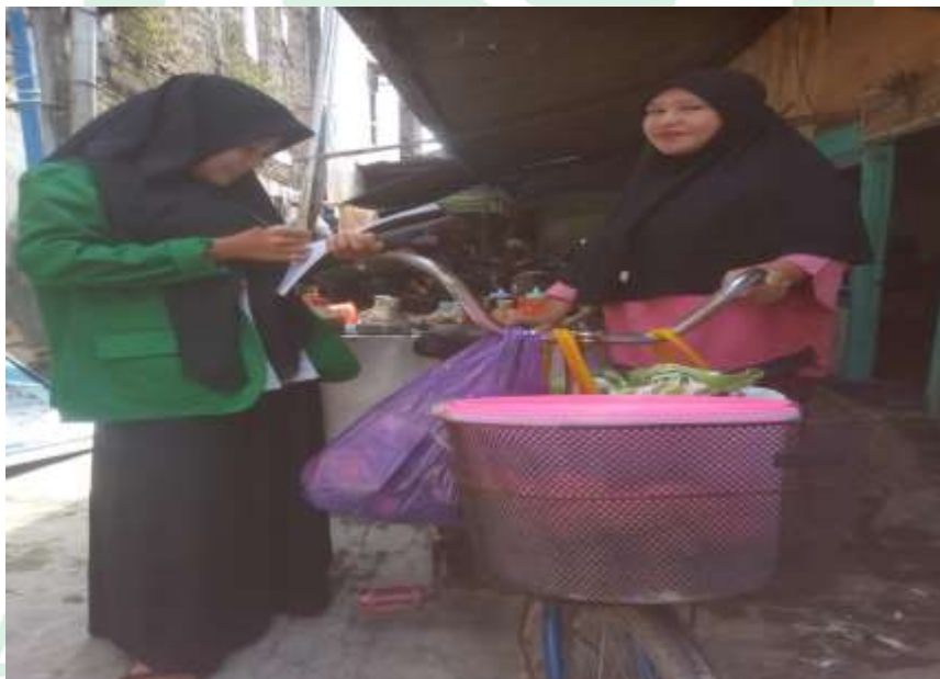
Dokumentasi bersama nasabah PNM Mekaar Syariah