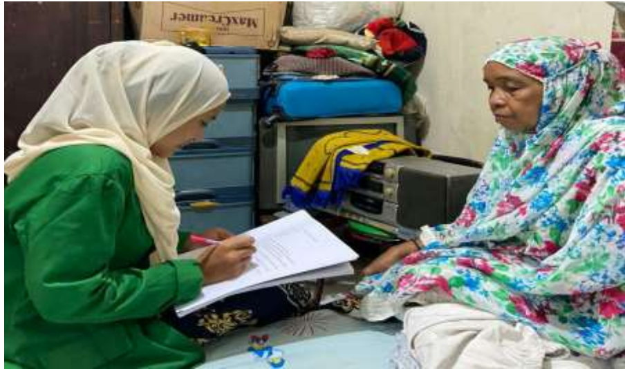
Dokumentasi bersama nasabah PNM Mekaar Syariah