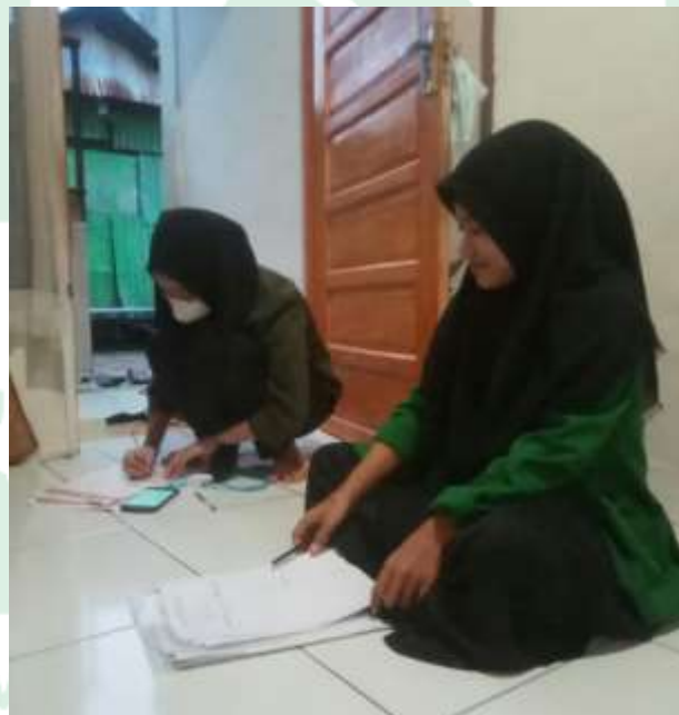
Dokumentasi bersama pegawai Mekaar Syariah