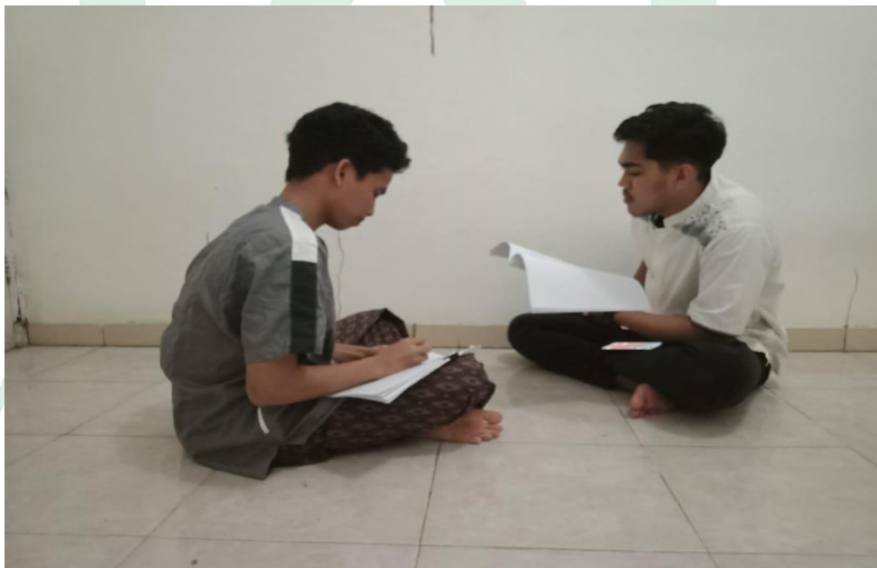
Wawancara : Kader Mahasiswa Pencinta Masjid