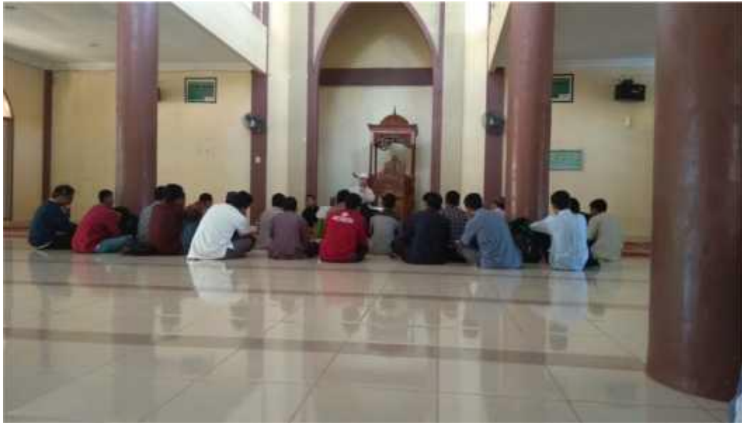
Dokumentasi kegiatan Ta'lim Tematik Rutin di Masjid kampus UIN Alauddin Makassar