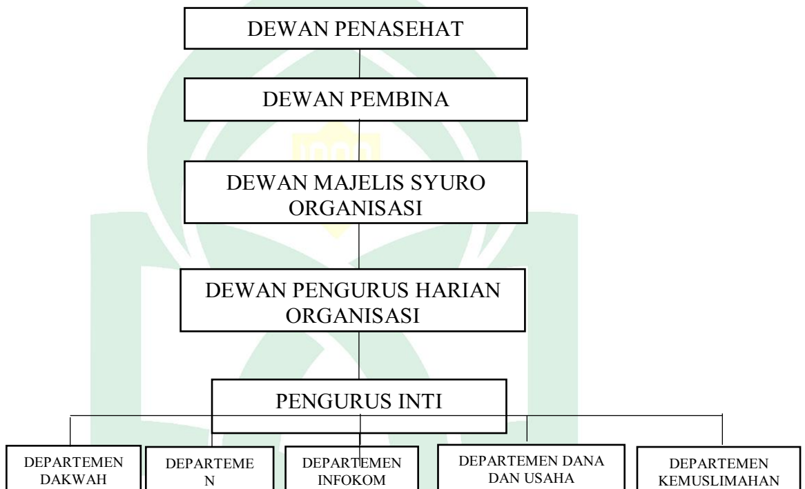
Tabel 4.1 Struktur Organisasi Mahasiswa Pecinta Masjid (MPM) UIN Alauddin Makassar