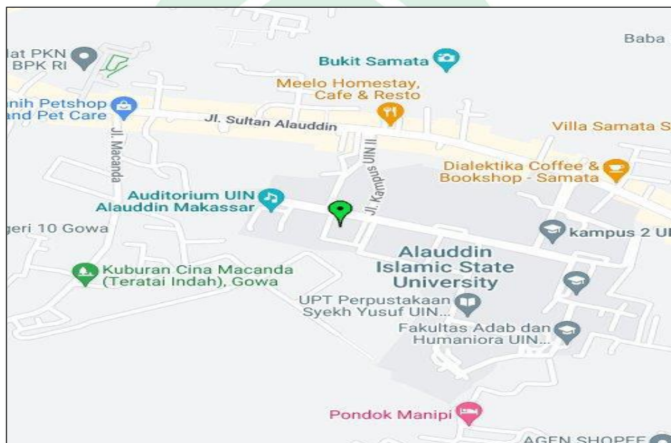
Gambar 4.1 Letak Geografis UIN Alauddin Makassar