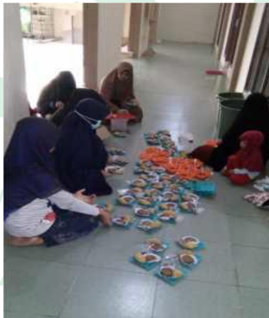
Dokumentasi kegiatan Ifthor Jama'i atau buka puasa bersama