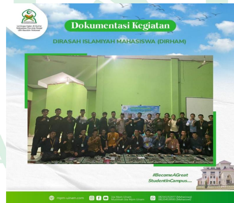
Dokumentasi Kegiatan DIRHAM (Dirasah Islamiyah Mahasiswa)