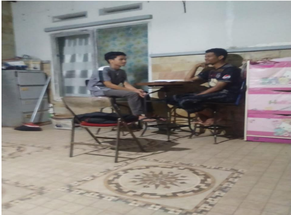
Wawancara : Pembina Mahasiswa Pencinta Masjid