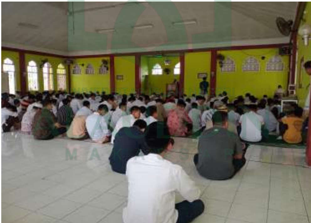
Kegiatan Salat Jum'at di Masjid Sultan Alauddin Paopao