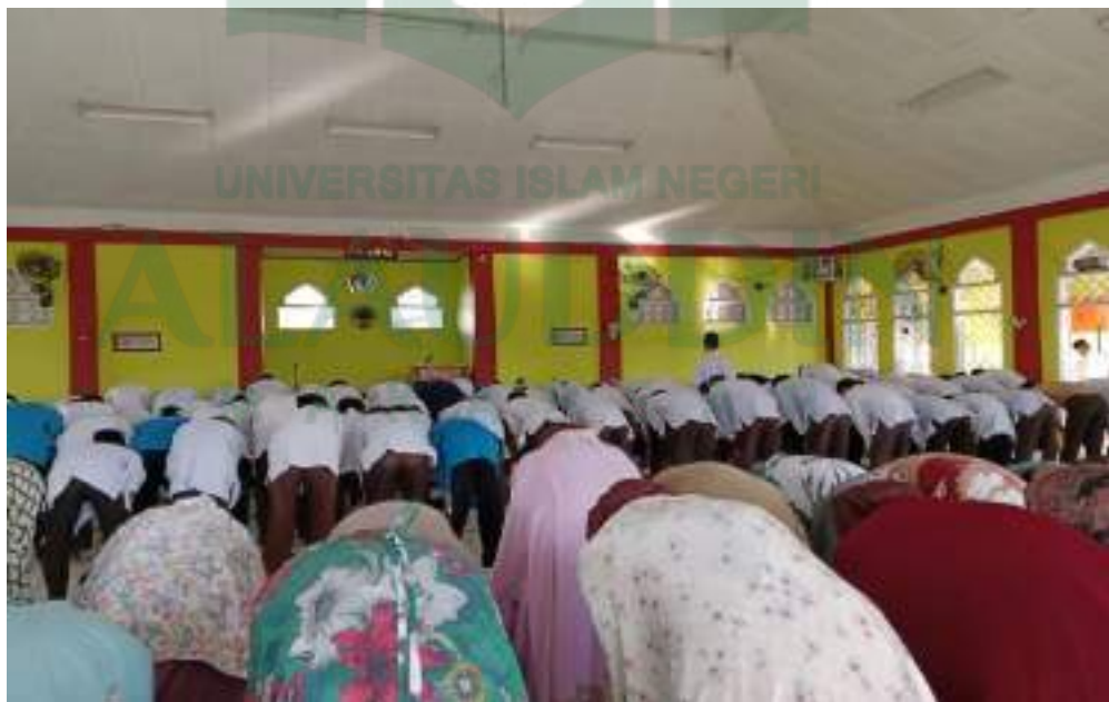
Kegiatan Salat Dhuha Berjama'ah di Masjid Sultan Alauddin Paopao