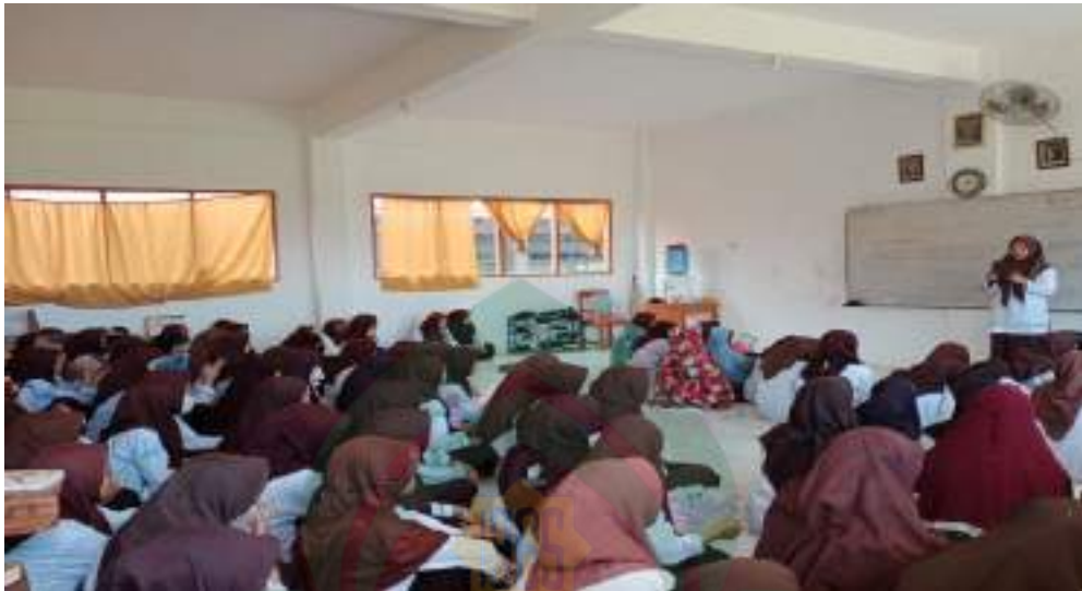
Kegiatan Muhadharah di Kelas XI MIA II