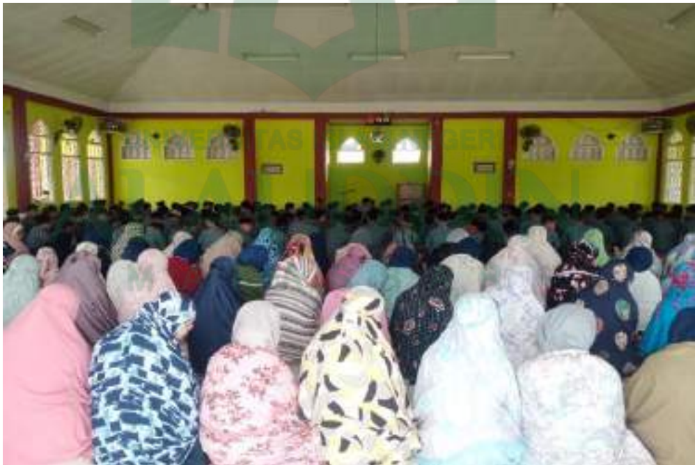
Kegiatan Salat Dzuhur Berjama'ah di Masjid Sultan Alauddin Paopao