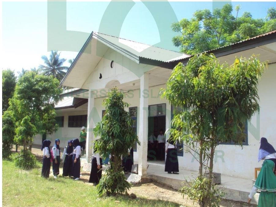
Gambar 2 : Ruang Kelas MTs Al-Wasilah Lemo(Tampak dari depan)