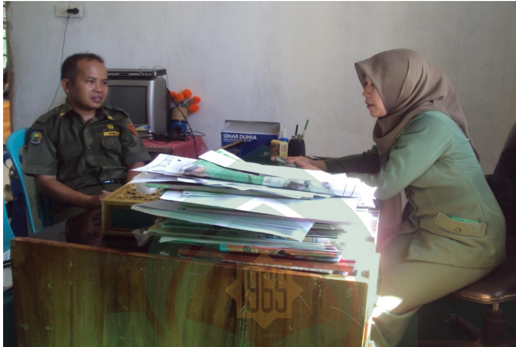
Suasana Ketika Peneliti Mengadakan Wawancara Dengan Kepala MTs Al-Wasilah Lemo