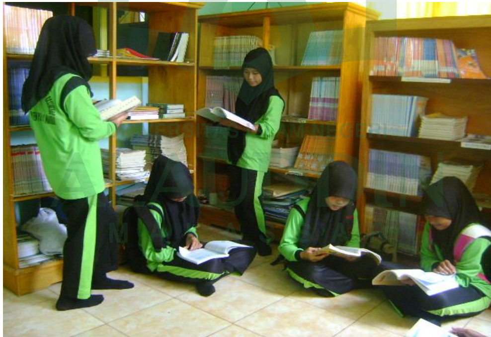
Suasana di Perpustakaan pada saat peserta didik mencari literatur terkait tugas-tugas yang diberikan oleh Guru Fikih MTs Al-Wasilah Lemo