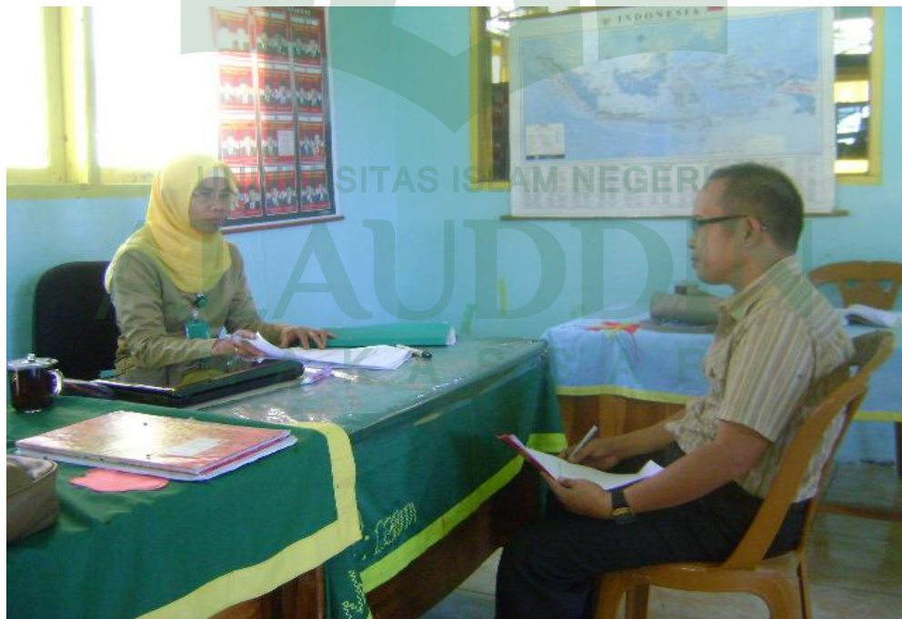
Suasana Ketika Peneliti Mengadakan Wawancara Dengan Guru FIKIH MTs Al-Wasilah Lemo