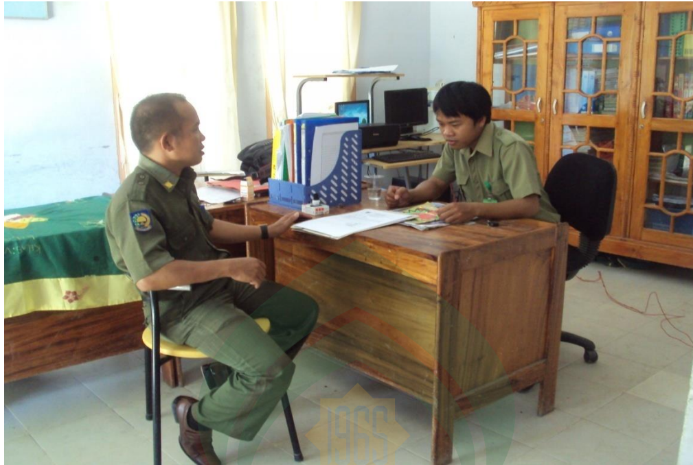
Suasana Ketika Peneliti Melakukan Wawancara Dengan Ka. TU. MTs Al-Wasilah Lemo