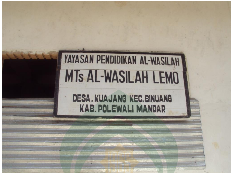
Gambar 1 : Kantor MTs Al-Wasilah Lemo (Tampak dari depan)