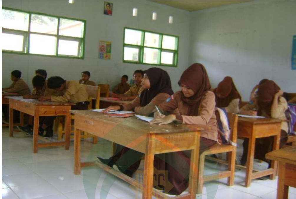
Suasana pembelajaran di kelas pada saat Guru Fikih memberikan tugas kepada Peserta Didik di MTs Al-Wasilah Lemo