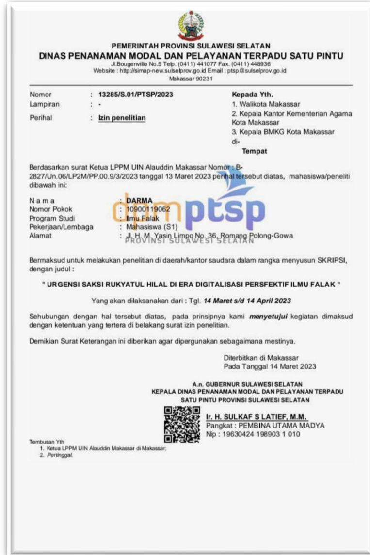
Gambar 1. Surat Izin Penelitian