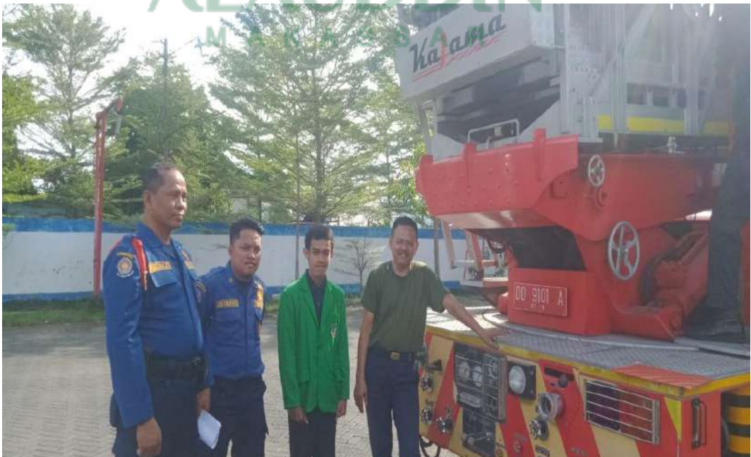
Dokumentasi 4. Pegawai Dinas pemadam Kebakaran