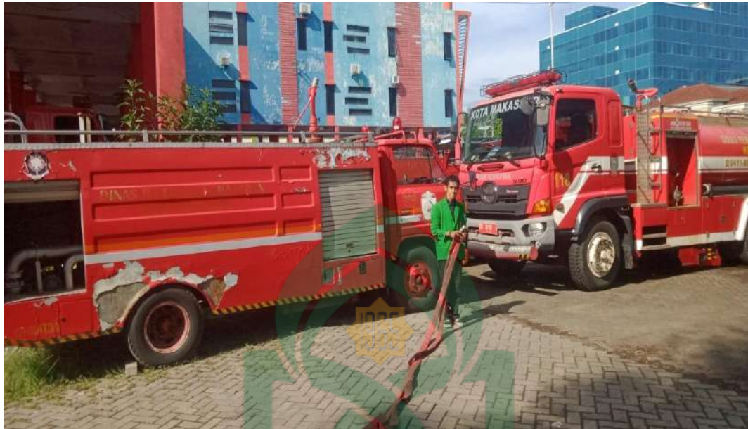
Dokumentasi 5. Mobil Pemadam Kebakaran