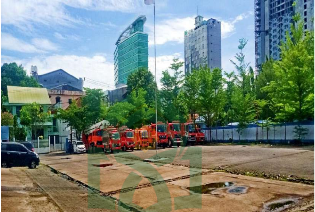
Dokumentasi 3. Suasana Lingkungan Dinas Pemadam Kota Makassar dengan latar belakang deretan Mobil Pemadam Kebakaran