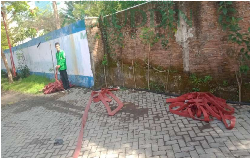
Dokumentasi 6. Selang Pemadam Kebakaran