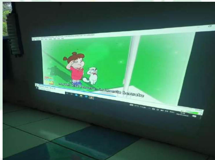
Dokumentasi Proses Pemutaran Media Film Animasi Pada Tanggal 8 Mei 2023