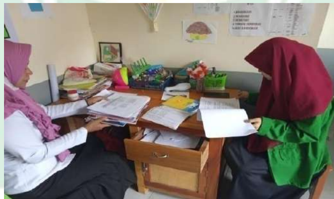
Gambar 4. 1 Wawancara kemampuan mengungkapkan bahasa anak usia 5-6 tahun kepada guru kelas B

Selain guru kelas B peneliti juga mewawancarai guru pendamping kelas B yang dijadikan sebagai objek serta data penelitian. Jumlah guru dalam kelas B yaitu ada dua guru yaitu ibu caheriaty, A.Ma. dan ibu selvi. Berikut hasil wawancara dengan guru pendamping kelas B ibu selvi yang juga dituangkan dalam bentuk tabel agar lebih jelas dan mudah dipahami yaitu sebagai berikut.