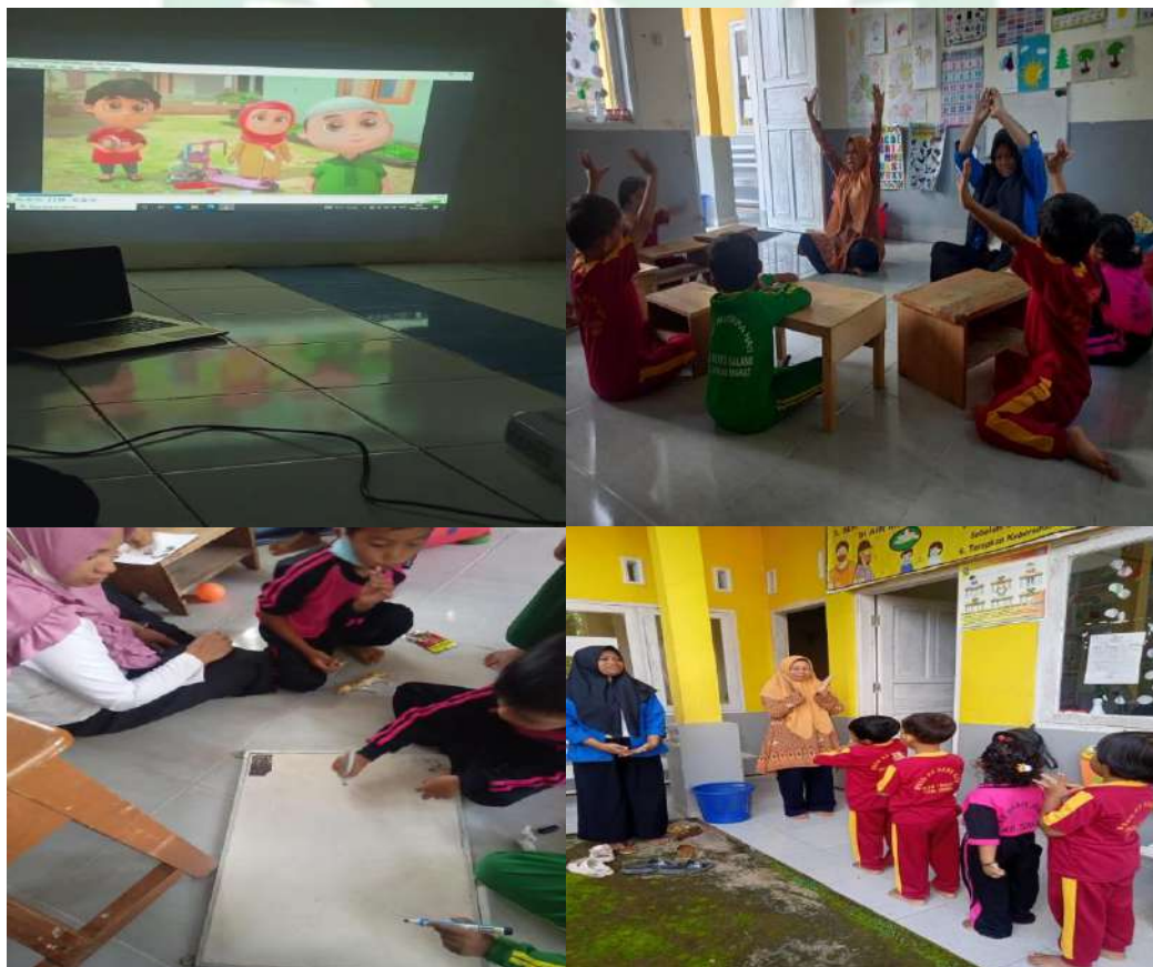
Dokumentasi proses pembelajaran dan pemutaran media film animasi pada tanggal 5 & 8 Mei 2023