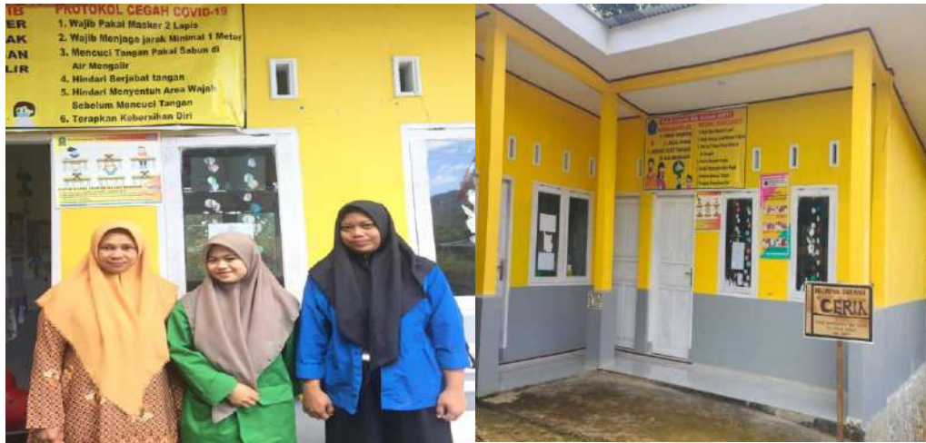
Dokumentasi bersama guru kelas B TK Ceria dan dokumentasi sekolah TK Ceria Desa Terasa pada tanggal 9 Mei 2023