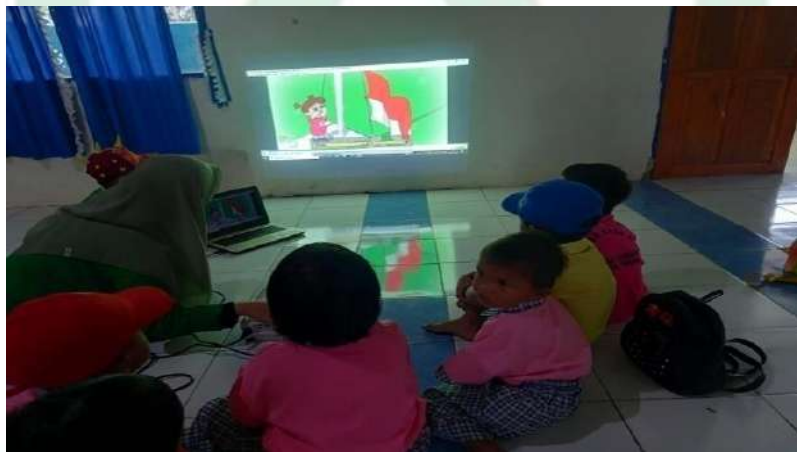
Gambar 4.2 pemutaran media film animasi

BSB = Kemampuan bahasa anak berkembang sangan baik