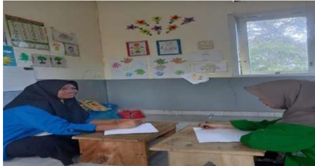
Gambar 4.2 Wawancara kemampuan mengungkapkan bahasa anak usia 5-6 tahun kepada guru pendamping kelas B

Berdasarkan wawancara peneliti menemukan hasil bahwa, guru kelas B dan Guru pendamping kelas B mempunyai pendapat yang berbeda mengenai kemampuan bahasa anak usia 5-6 tahun di TK Ceria Desa Terasa namun ada juga pendapat yang hampir sama, selain wawancara peneliti juga melakukan observasi yang dituangkan dalam bentuk tabel sebagai berikut. 5