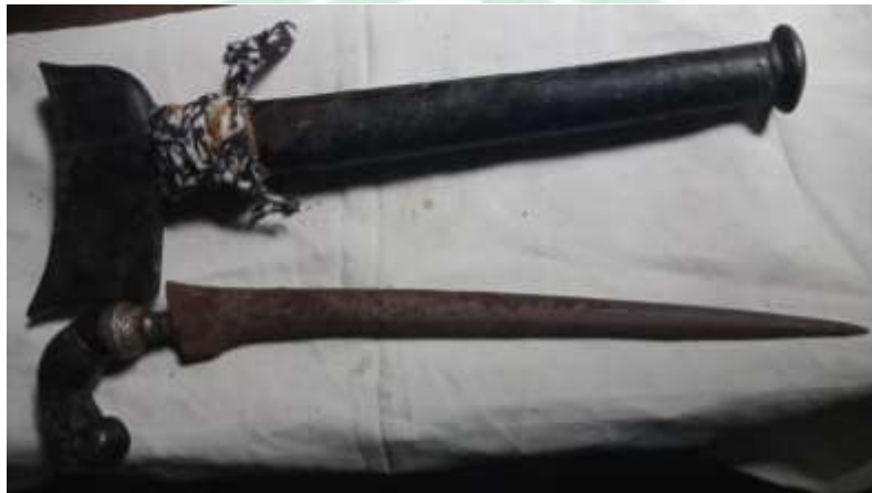
Gambar 2 : Keris Madeceng