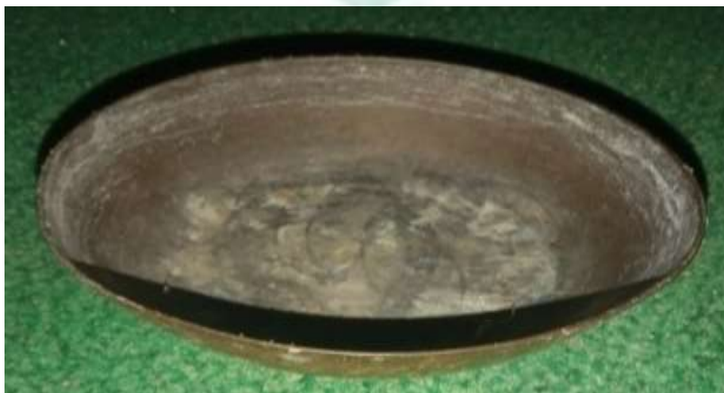
Gambar 14 : Mangko Gallang