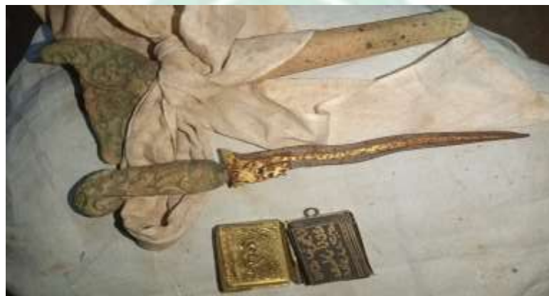
Gambar 5 : Keris Na Tujuh