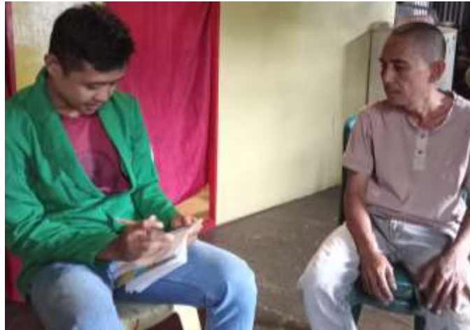
Wawancara dengan Puang Ancong