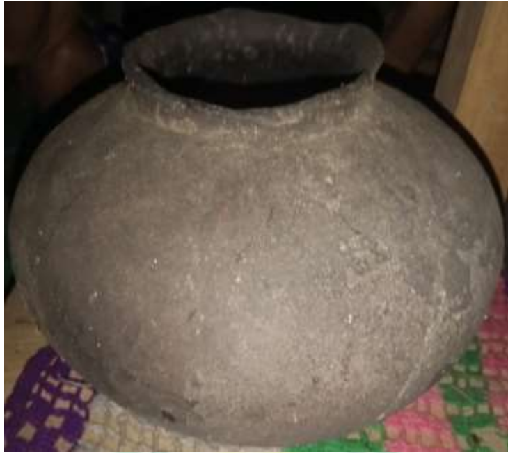
Gambar 15: Gumbang Berasa'