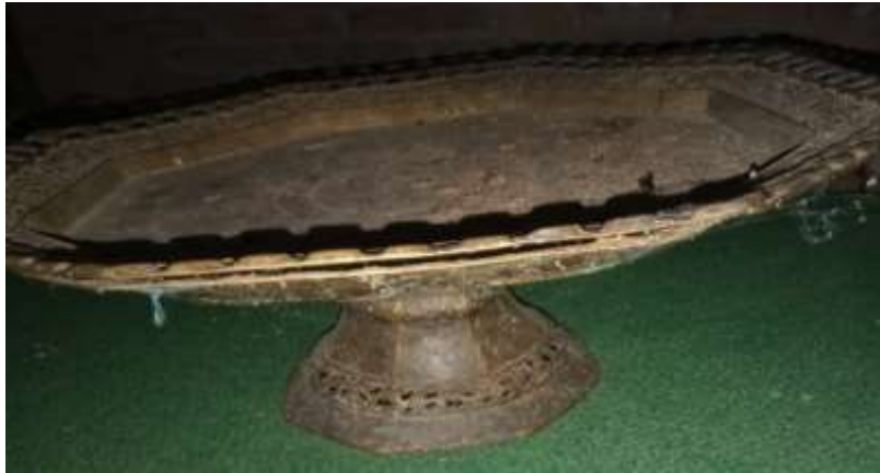
Gambar 12 : Kappara Gallang