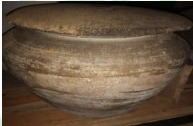
Gambar 16 : Gumbang Ere/Air