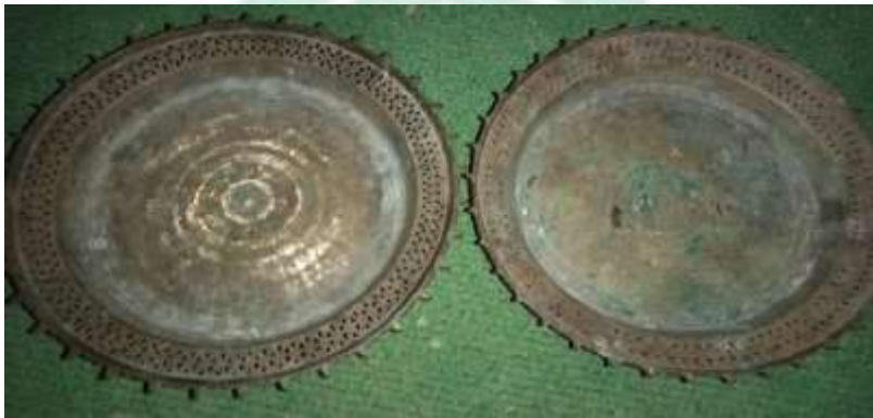
Gambar 13 : Piring Gallang