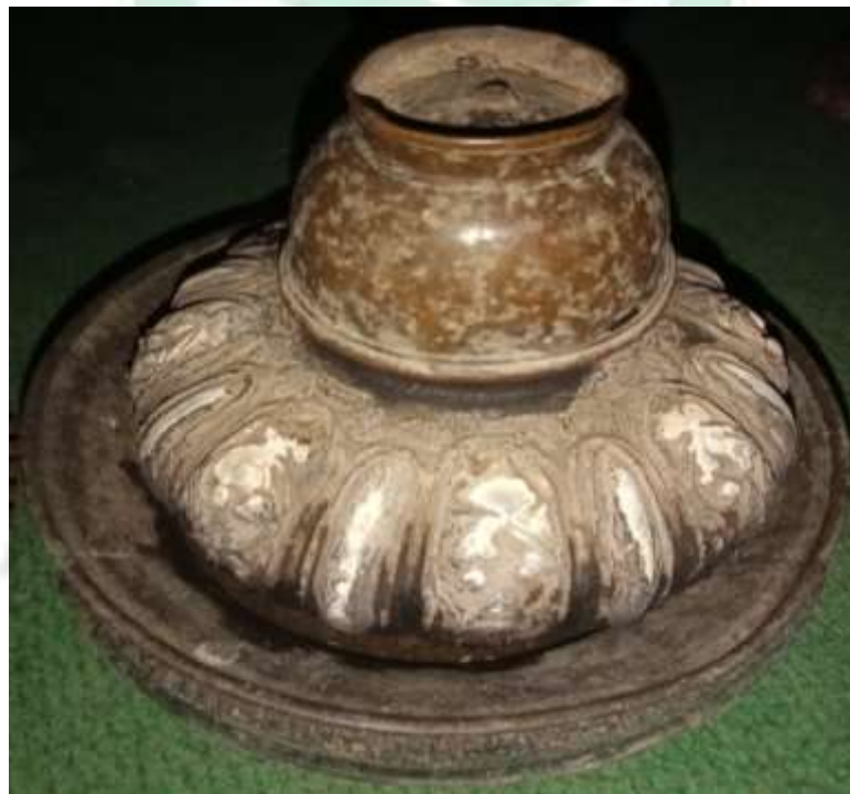
Gambar 11 : Guci Madeceng