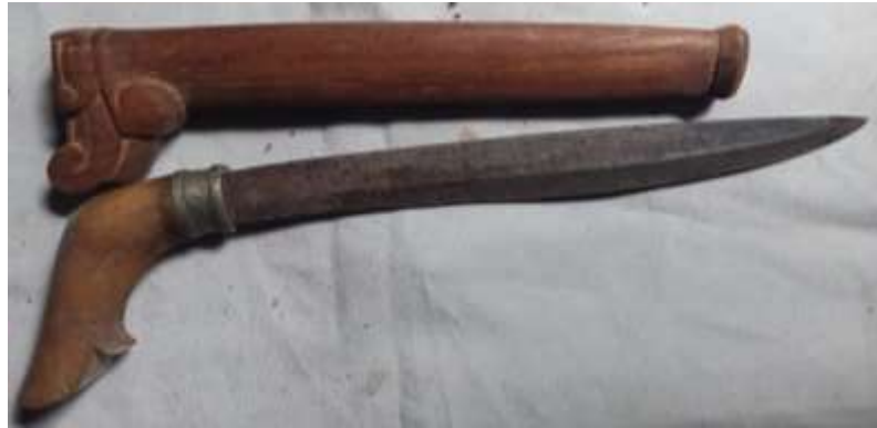
Gambar 7 : Badik Lagoceng