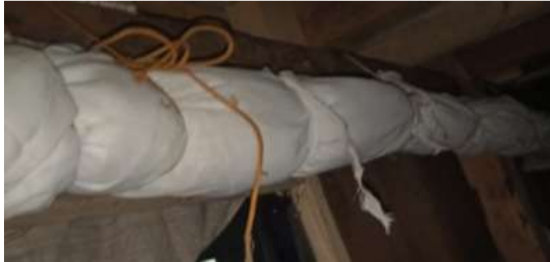
Gambar 1 : Rihata Pattunggia