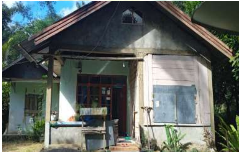
Gambar 18 : Bola toayya

UNIVERSITAS BOLA TOAYYA ALAUDDIN MAKASSAR