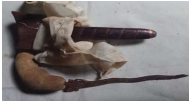
Gambar 4 : Keris Ulara'