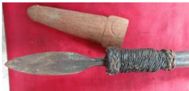
Gambar 9 : Poke Murang