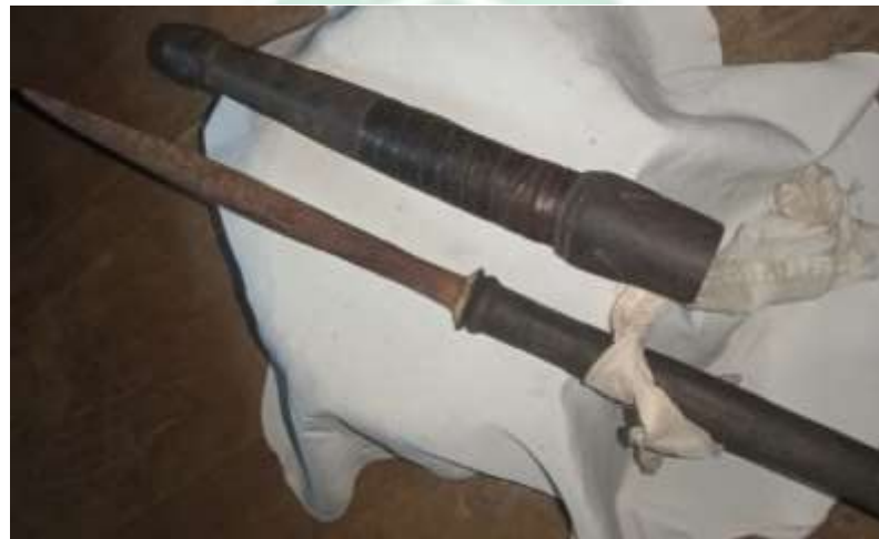
Gambar 8 : Poke