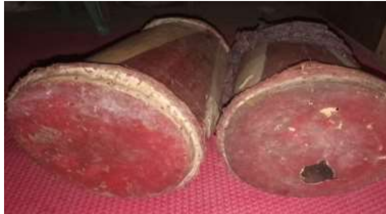
Gambar 17 : Gendang Adat