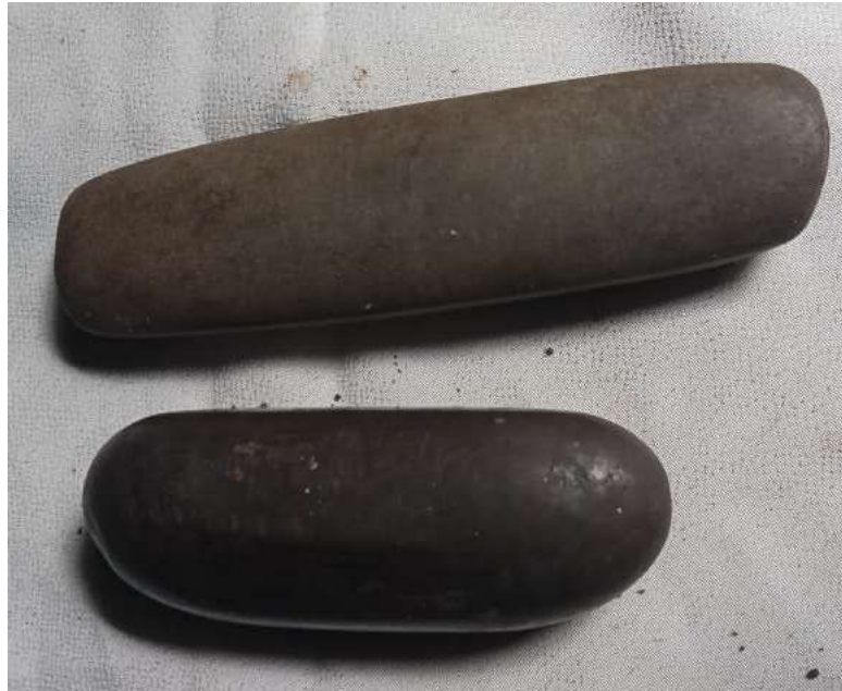
Gambar 10 : Asaang