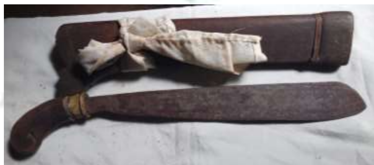
Gambar 6 : Merang Madeceng