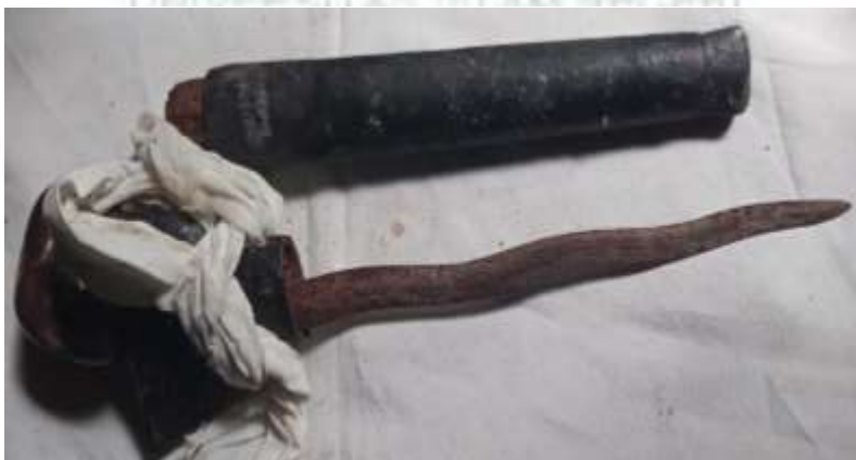
Gambar 3 : Keris Ular Naga