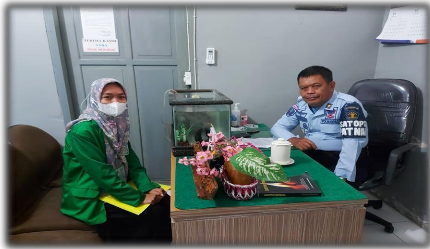
Wawancara dengan Kasi Binadik Lembaga Pemasyarakatan Kelas II A Bulukumba