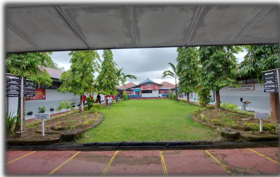
Pekarangan sekitar Lembaga Pemasyarakatan Kelas II A Bulukumba