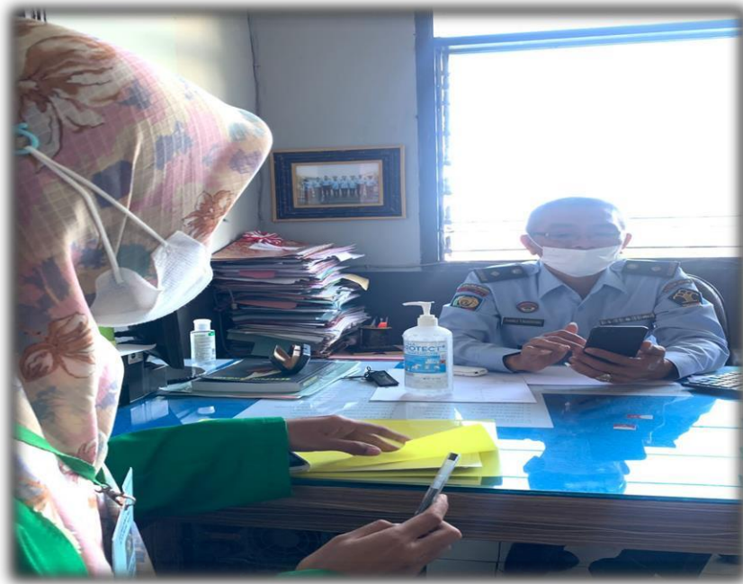
Wawancara kembali bersama Kasi Registrasi Lembaga Pemasarakatan Kelas II A Bulukumba