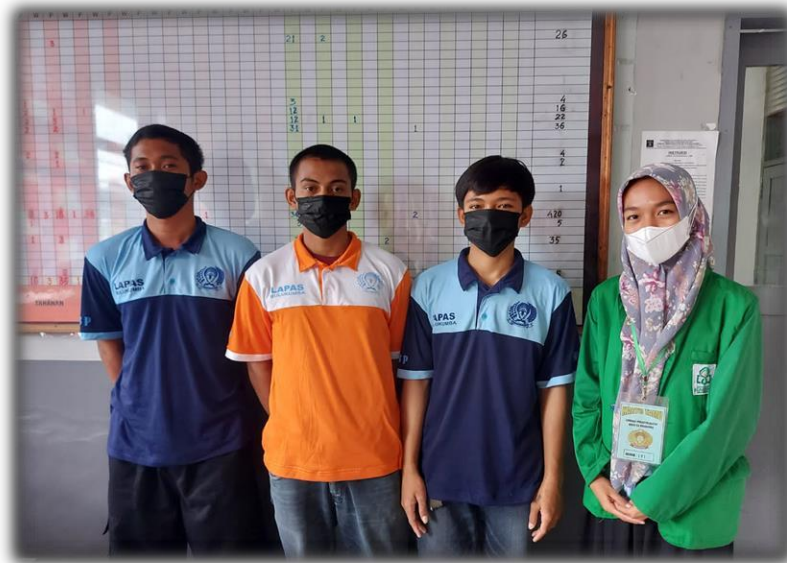
Bersama ketiga Narapidana Anak Lembaga Pemasyarakatan Kelas II A Bulukumba