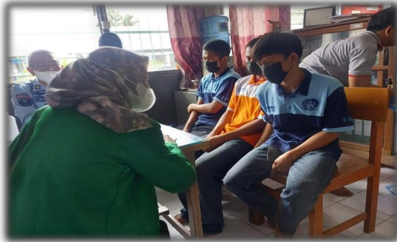
Wawancara dengan narapidana anak Lembaga Pemasarakatan Kelas II A Bulukumba