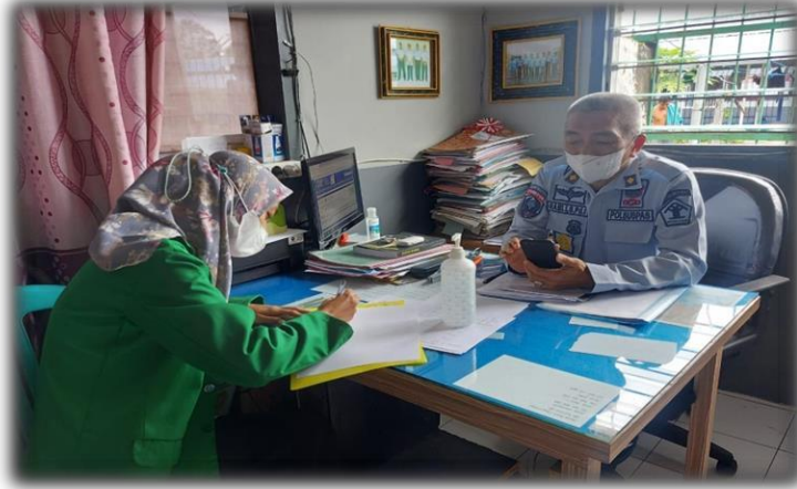
Wawancara dengan kasi registrasi Lembaga Pemasarakatan Kelas II A Bulukumba