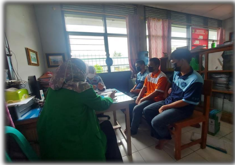
Wawancara bersama dengan narapidana Anak dan kasi Binadik Lembaga Pemasyarakatan Kelas II A Bulukumba