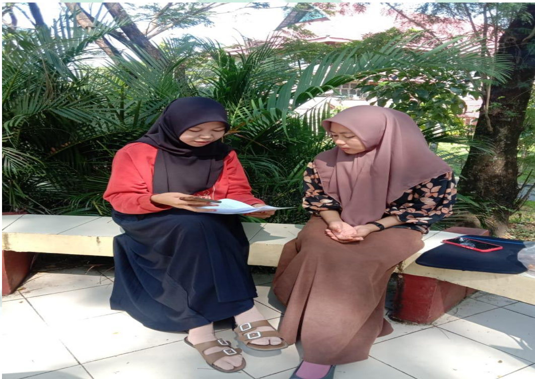
Foto 2. Proses wawancara dengan MS di Taman lapangan sepak bola UINAM pada tanggal 19 April 2023