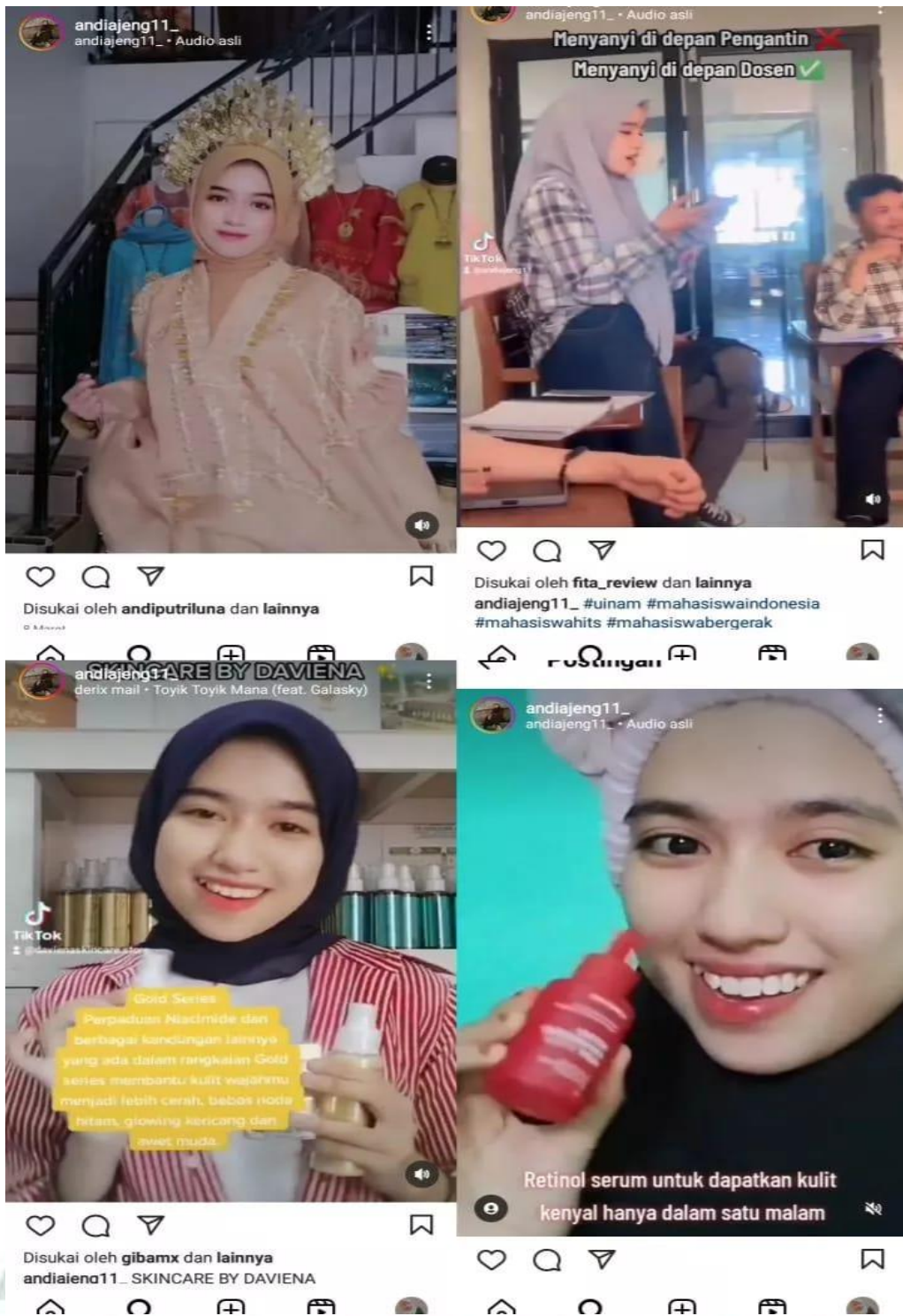
Foto 11. Contoh konten yang mempromosikan baju bodo, menyanyi dalam kelas dan mempromosikan produk skincare dipublikasikan oleh ATA di media sosial (akun instagram) diakses tanggal 20 April 2023