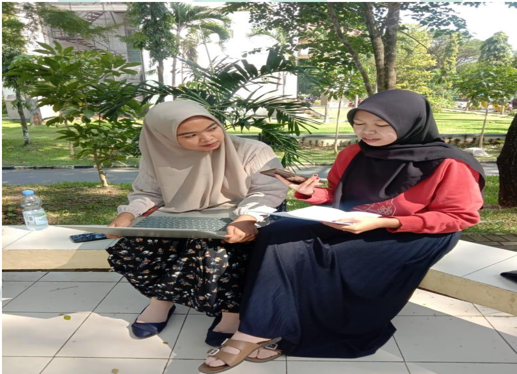
Foto 1. Proses wawancara dengan AN di Taman lapangan sepak bola UINAM pada tanggal 19 April 2023