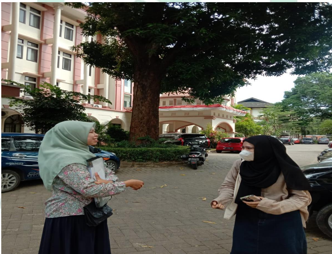
Foto 7. Proses wawancara dengan ATA di Halaman Fakultas Saintek UINAM pada tanggal 12 April 2023