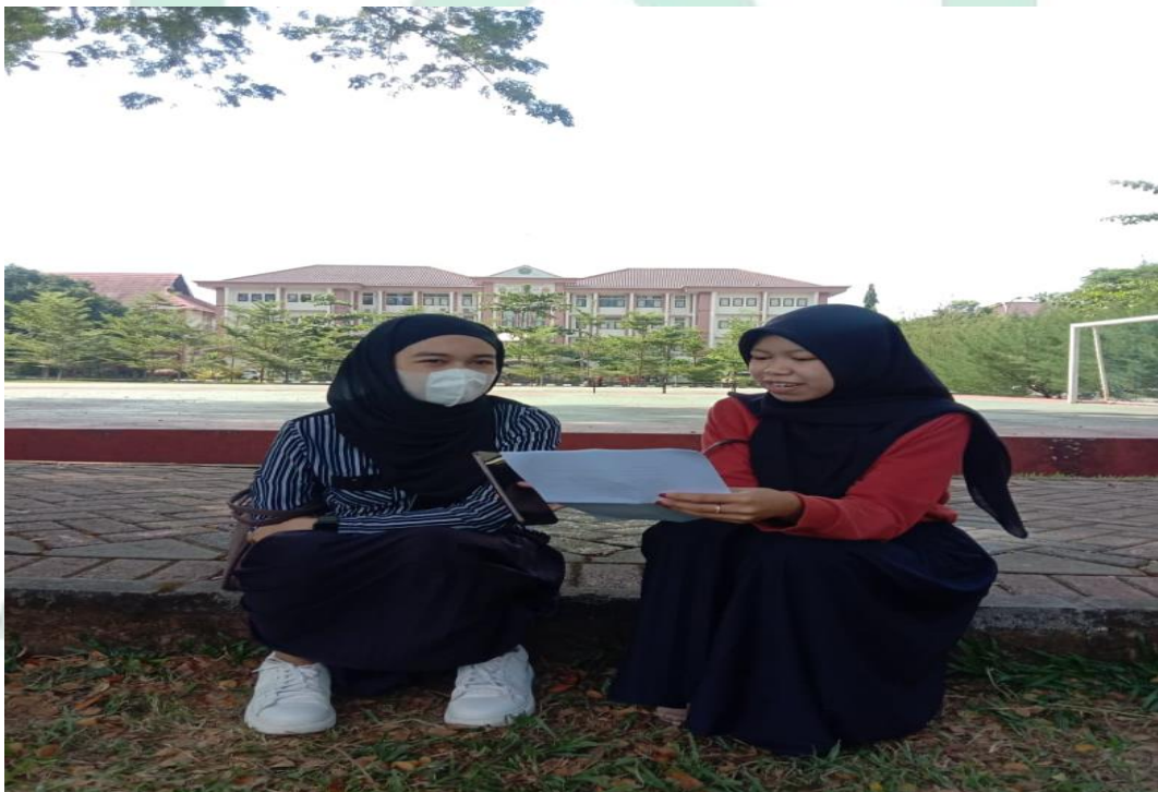
Foto 3. Proses wawancara dengan FT di samping lapangan basket UINAM pada tanggal 19 April 2023