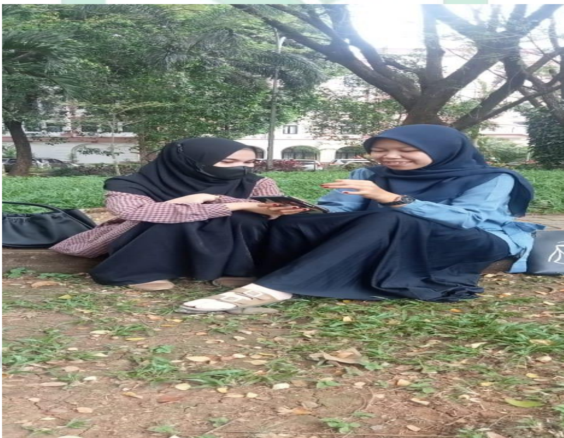
Foto 5. Proses wawancara dengan ADM di halaman Fakultas FEBI UINAM pada tanggal 20 April 2023