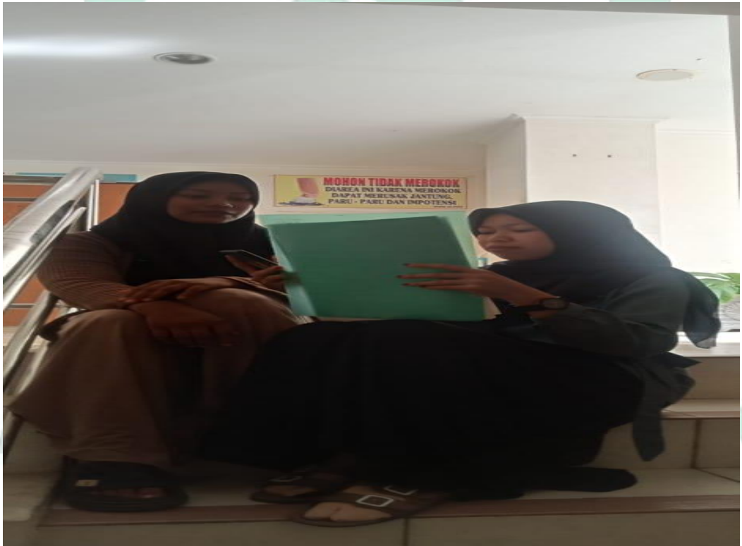
Foto 6. Proses wawancara dengan MGF di tangga lantai dua FUF UINAM pada tanggal 20 April 2023