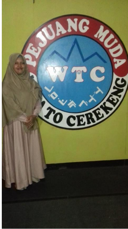
Wawancara bersama masyarakat