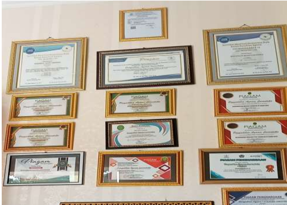
Ruang Pegawai PA Larantuka