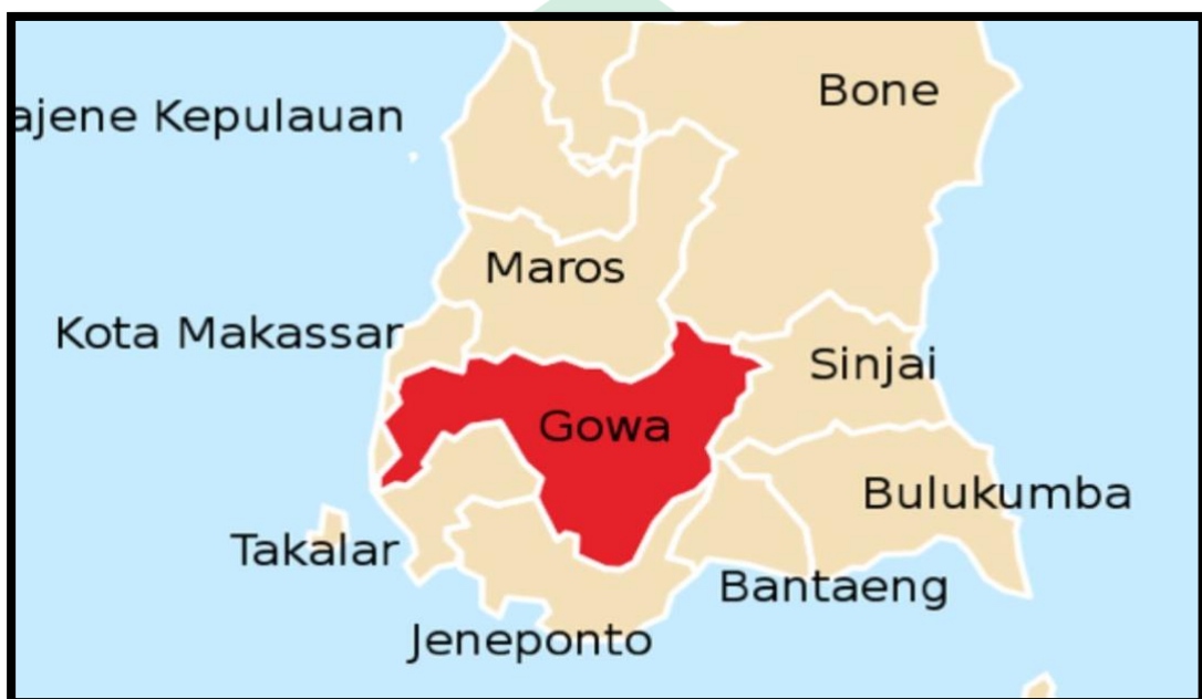
Gambar. 4.1. Peta Adminitrasi Kabupaten Gowa 1

Kabupaten Gowa berada pada Bujur 119° sampai 120° Bujur Timur, dan Lintang -5° sampai -5°Lintang Selatan, Kabupaten yang berada di daerah Selatan dari Sulawesi Selatan merupakan daerah otonom, di sebelah Utara berbatasan dengan Kota Makassar dan Kabupaten Maros, di sebelah Timur berbatasan dengan Kabupaten Sinjai, Bulukumba dan Bantaeng, di sebelah Selatan