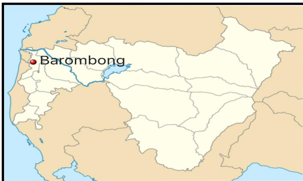
Gambar 4.2. Peta Administrasi Kecamatan Barombong Kabupaten Gowa 2

Wilayah administrasi Kabupaten Gowa terdiri dari 18 kecamatan dan 167 desa/kelurahan dengan luas sekitar 1,883,33 kilometer persegi atau sama dengan 3,01 persen dari luas wilayah Provinsi Sulawesi Selatan, Wilayah Kabupaten Gowa sebagian besar merupakan dataran tinggi yaitu sekitar 72,26 persen, Ada 9 wilayah kecamatan yang merupakan dataran tinggi yaitu Parangloe, Manuju, Tinggimoncong, Tombolo Pao, Parigi, Bungaya, Bontolempangan, Tompobulu dan Biringbulu, Dari total luas Kabupaten Gowa 35,30 persen mempunyai kemiringan tanah di atas 40 derajat, yaitu pada wilayah kecamatan Parangloe, Tinggimoncong, Bungaya dan Tompobulu, Kabupaten Gowa dilalui oleh banyak sungai yang cukup besar yaitu ada 15 sungai, Sungai dengan luas daerah aliran yang terbesar adalah Sungai Jeneberang yaitu seluas 881 km 2 dengan panjang 90 km, salah satu Kecamatan di Kabupaten Gowa adalah Kecamatan Barombong.