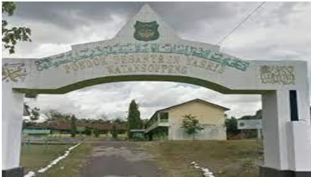
Gambar 2. Pondok Pesantren Yasrib Soppeng

Pondok Pesantren Yasrib (Yayasan Perguruan Islam Beowe) merupakan salah satu pesantren yang berada di Soppeng tepatnya di Kelurahan Lapajung yang masih tetap eksis sampai sekarang. Pengambilan nama Pesantren Yasrib (Yayasan Perguruan Islam Beowe) mengambil nama dari Datu ke XIV Kerajaan Soppeng yaitu Datu Beowe, Datu pertama yang memeluk ajaran agama Islam. Pesantren Yasrib