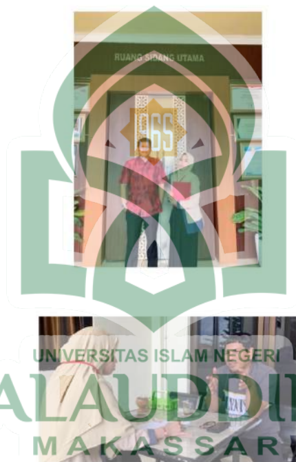
FOTO WAWANCARA BERSAMA HAKIM PENGADILAN AGAMA KELAS IB SUNGGUMINASA