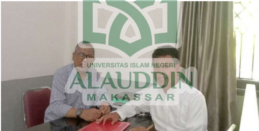
Gambar 7 : Wawancara dengan Tokoh Nahdhatul Ulama Kab. Gowa dan komisi Fatwa MUI Kab. Gowa dan Sulawesi Selatan.