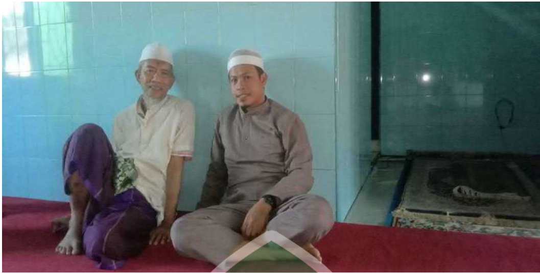
Gambar 6 : Wawancara dengan Tokoh Masyarakat Kelurahan Katangka, Kecamatan Somba Opu.