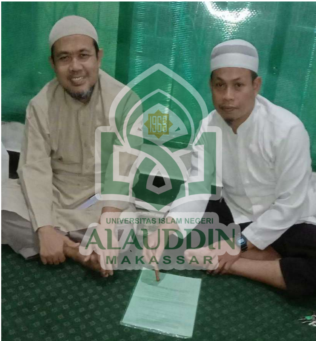
Gambar 5 : Wawancara dengan Tokoh Agama di Kelurahan Katangka, Kecamatan Somba Opu