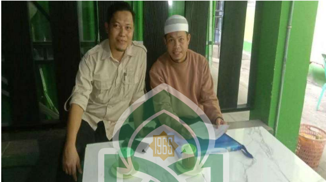
Gambar 3 : Wawancara dengan Penghulu Kecamatan Somba Opu