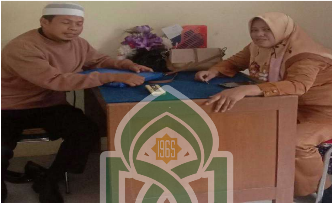
Gambar 1 : KA Seksi Pembinaan Desa/Kelurahan Kecamatan Somba Opu