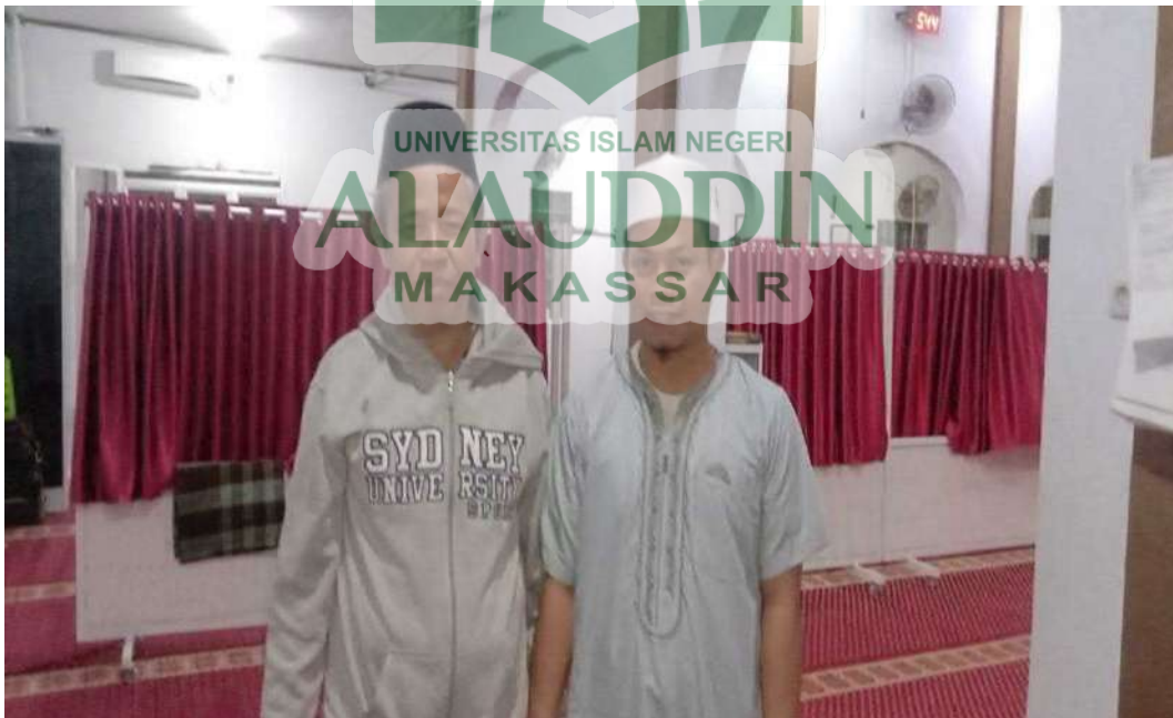
Gambar 4 : Wawancara dengan Pengurus Masjid di Bonto-Bontoa, Kecamatan Somba Opu