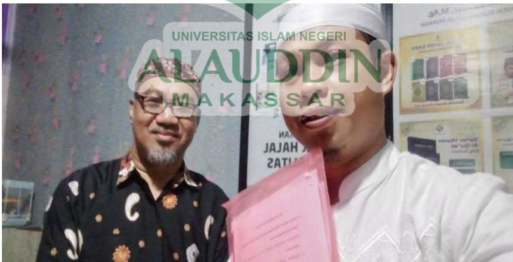
Gambar 2 : Wawancara dengan Tokoh Agama di kelurahan Samata, Kecamatan Somba Opu