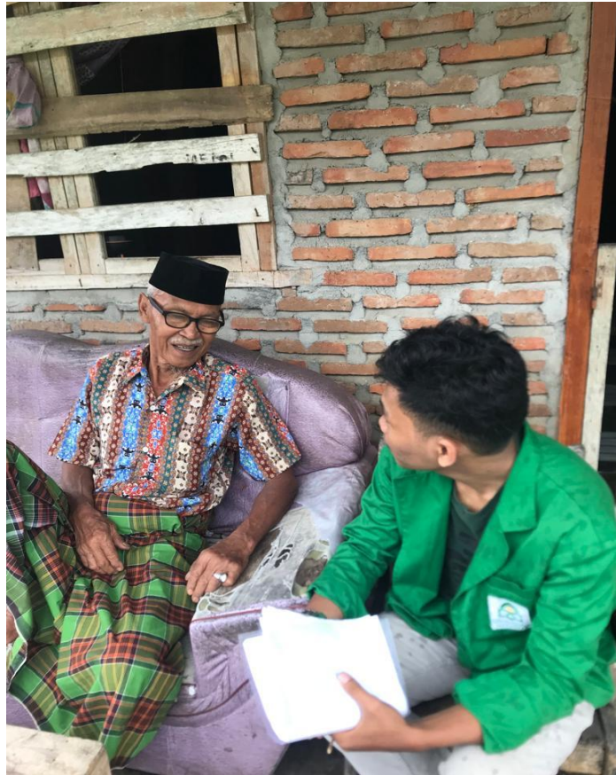
Wawancara dengan Tokoh Masyarakat