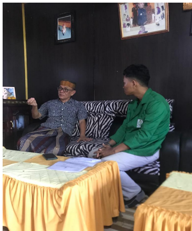
Wawancara dengan Ketua Lembaga Adat Langnge-Langnge