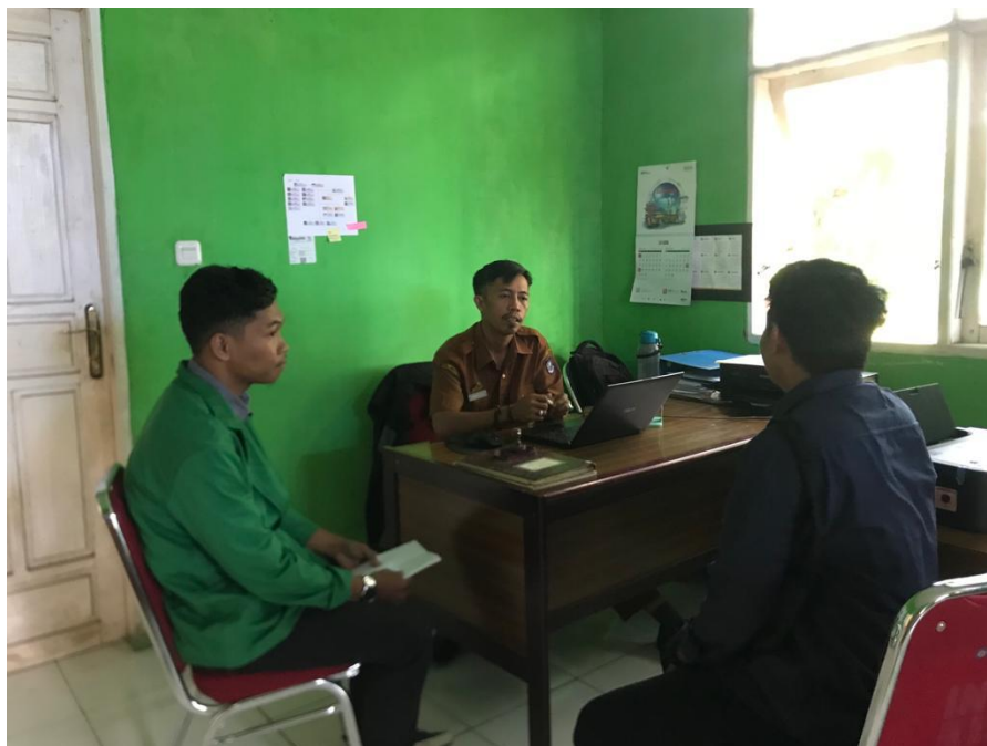
Wawancara dengan Aparat Pemerintah