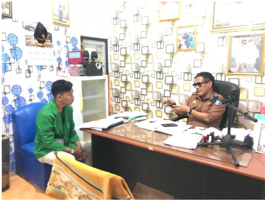
Wawancara dengan Sekretaris Camat Herlang