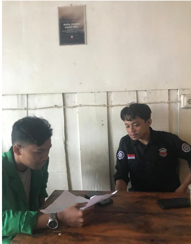
Wawancara dengan Tokoh Pemuda