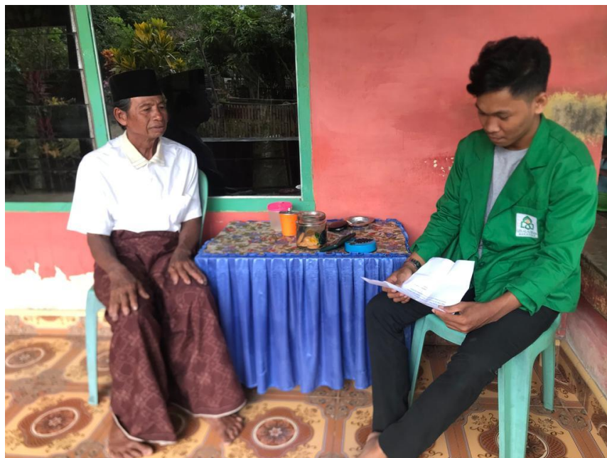
Wawancara dengan Tokoh Masyarakat