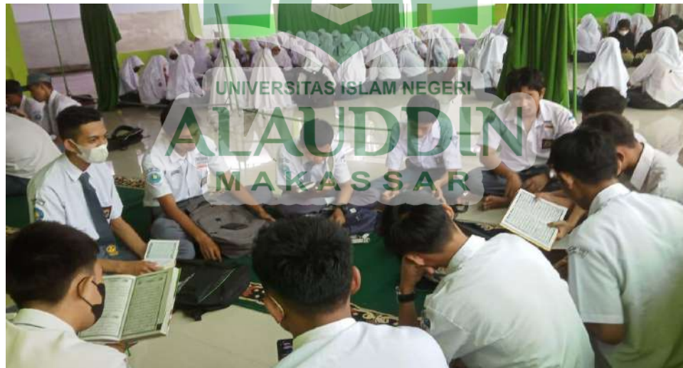
Kegiatan Tadarrus Alquran di Bulan Ramadhan