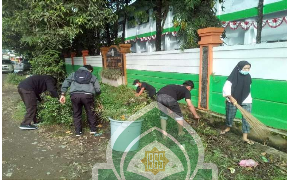
Kegiatan Gotong Royong Membersihkan Lingkungan Sekolah