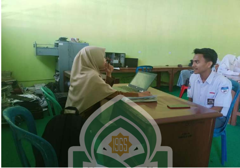
Wawancara bersama Peserta didik