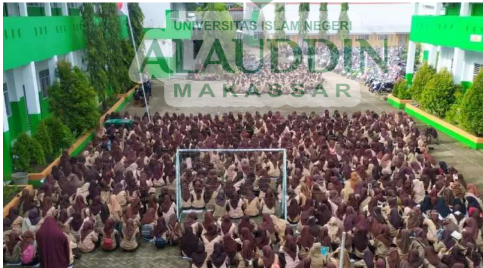
Kegiatan Jum'at Ibadah di SMKN 1 Gowa