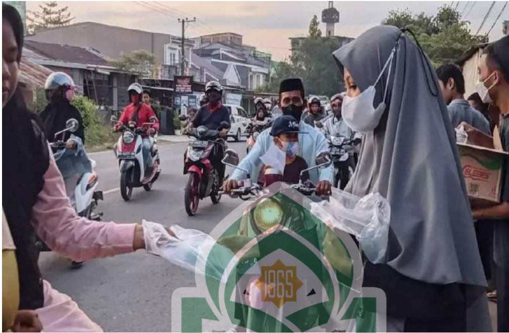
Kegiatan Berbagi menu buka puasa di Bulan Ramadhan

UNIVERSITAS ISLAM NEGERI ALAUDDIN MAKASSAR