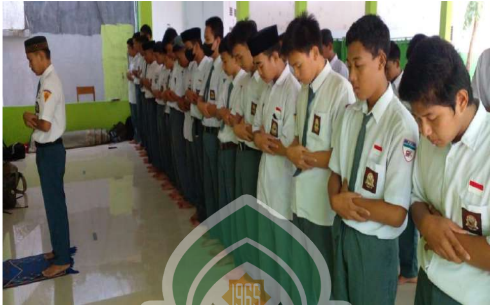
Sholat Berjamaah Peserta Didik di SMKN 1 Gowa