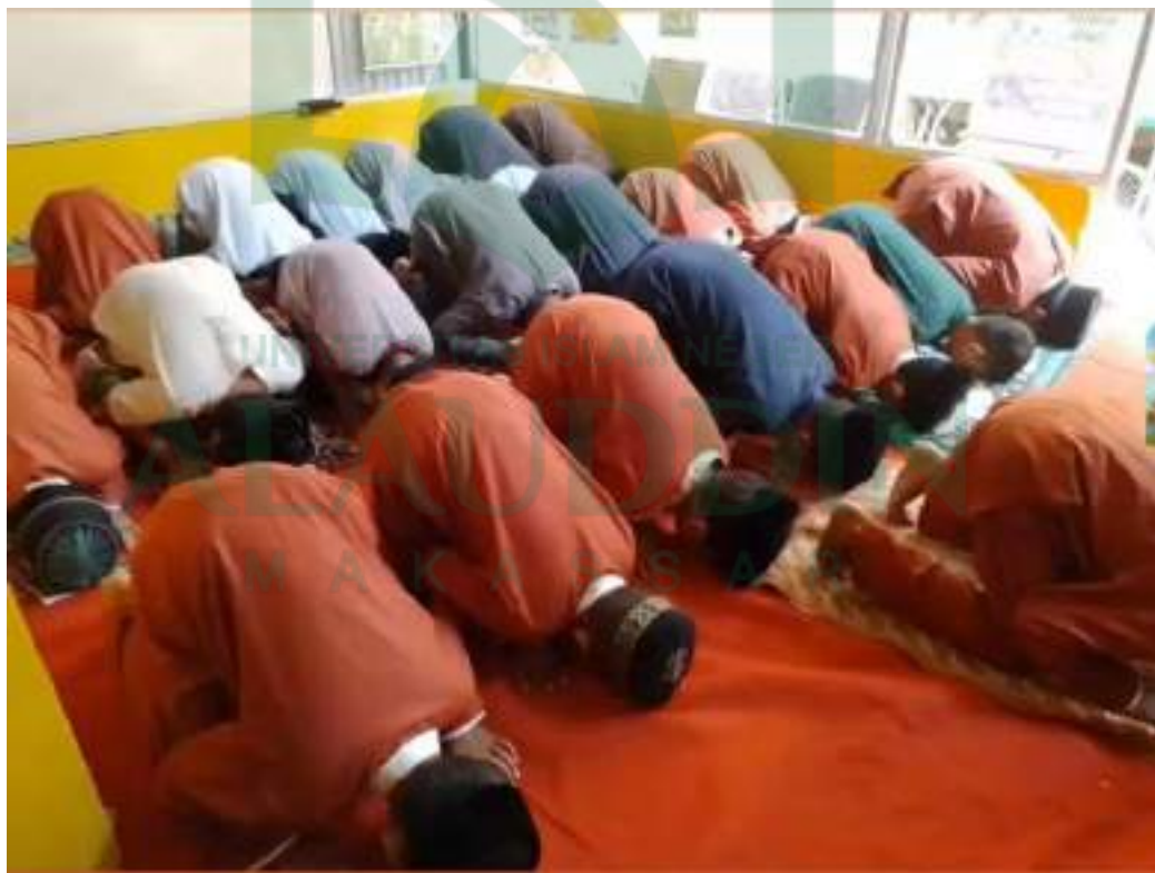
Gambar 4: dokumentasi proses pembinaan karakter dan akhlak siswa SD Inpres Taeng-Taeng Kelurahan Paccinongang