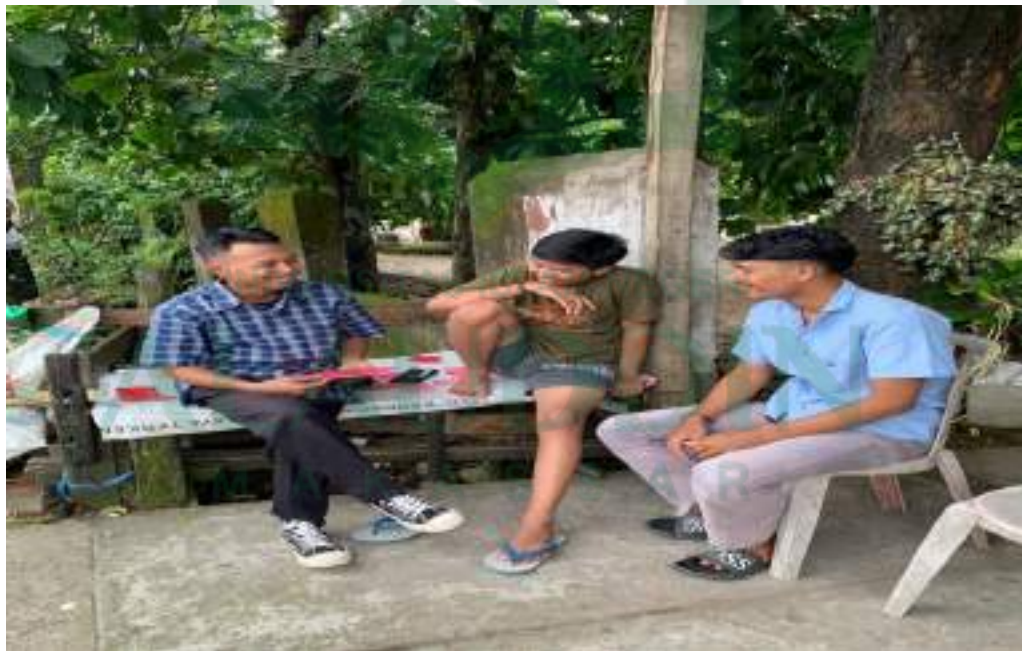
Gambar 3: wawancara dengan anggota masyarakat diluar RT 002/RW 009 (lingkungan tetangga)