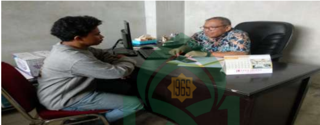
Kota Makassar dan kegemaran budaya membaca