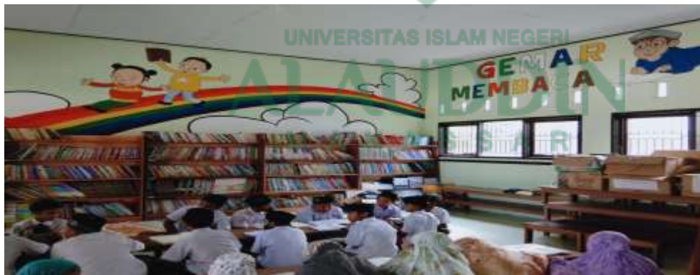
Gambar 2. Ruang perpustakaan sekolah SMPN SATAP 41 Lae-Lae