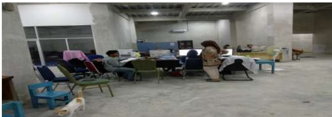
Gambar 3. Ruang tengah perpustakaan Kota Makassar