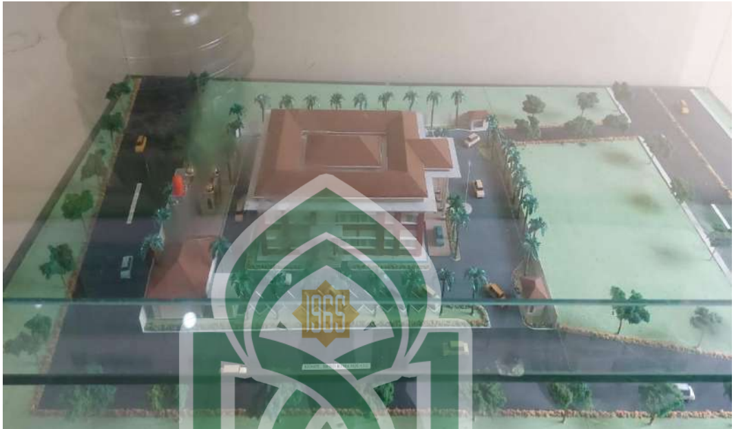
Lokasi Pengadilan Agama Kelas 1A Makassar