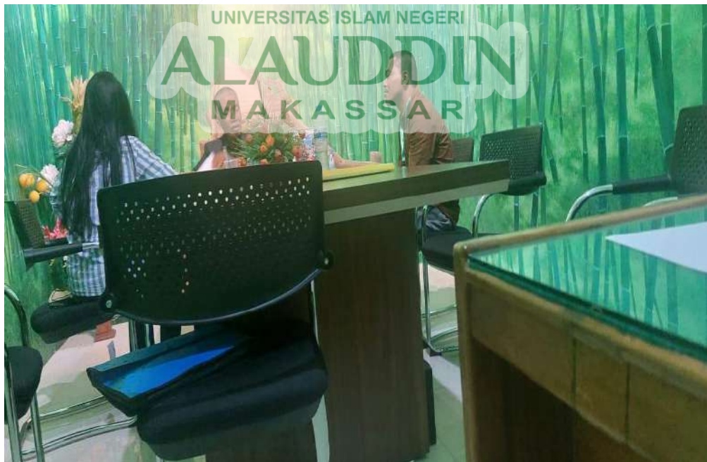
Mediasi An. Ajeng (Penggugat 25 Tahun) Makassar Senin 12 Desember 2022