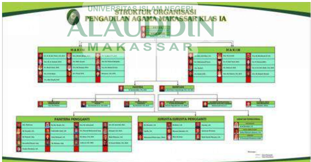
Struktur Organisasi Pengadilan Agama Kelas 1A Makassar