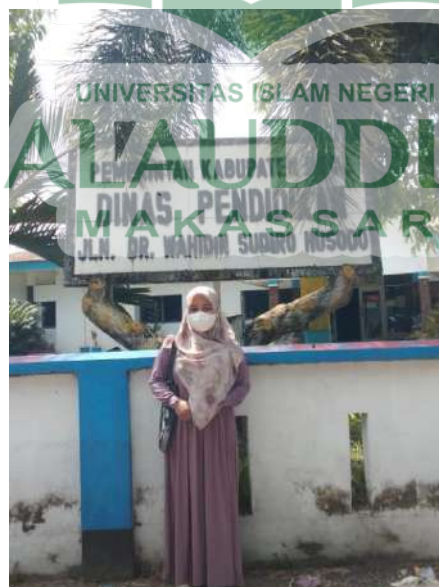
Gambar. 3 Pintu masuk Kantor Dinas Pendidikan Kabupaten Bone