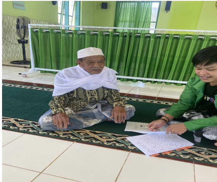
Wawancara dengan tokoh agama JHP