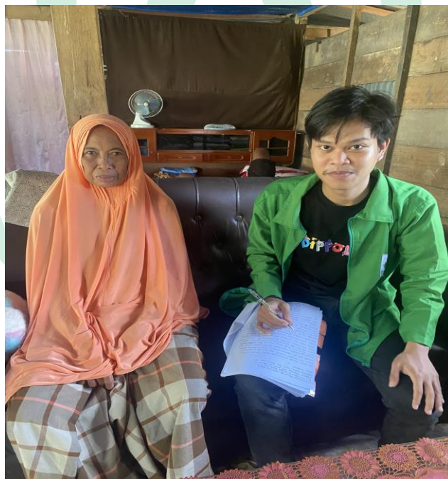
Wawancara dengan dukun bayi MH