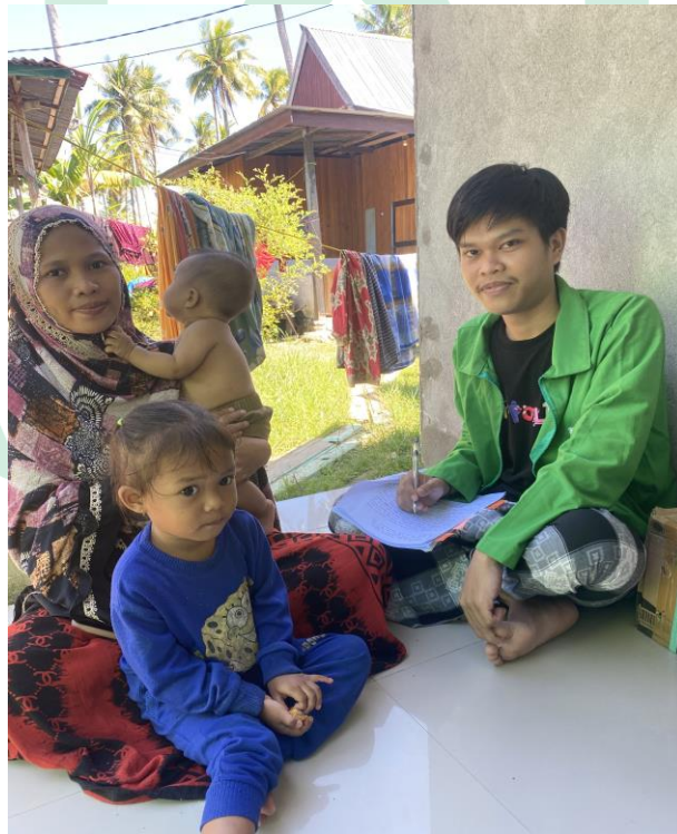
Wawancara dengan tokoh masyarakat SR