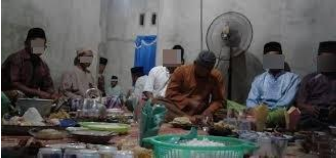
Gambar 1.1 Pelaksanaan tradisi No'risalo