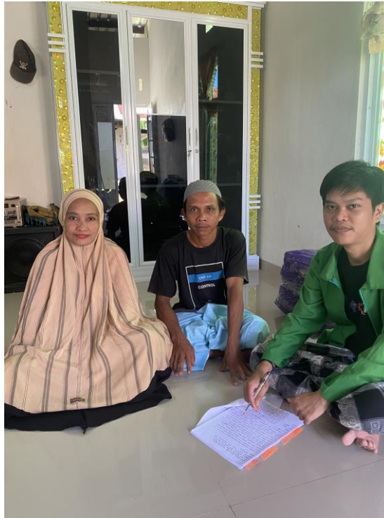
Wawancara dengan tokoh masyarakat TN dan WR