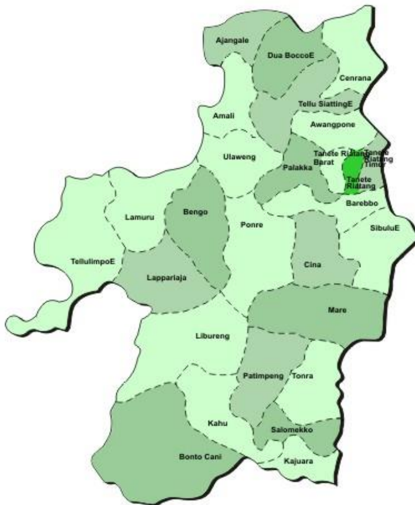
Gambar 1. Peta Kabupaten Bone