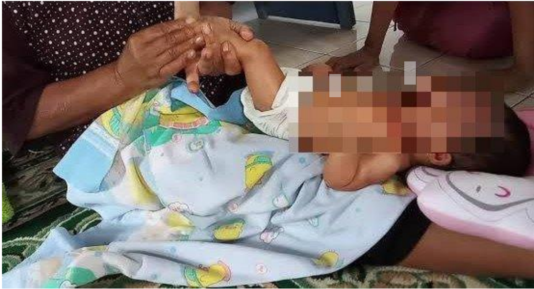
Gambar 1.3 pemijatan bayi