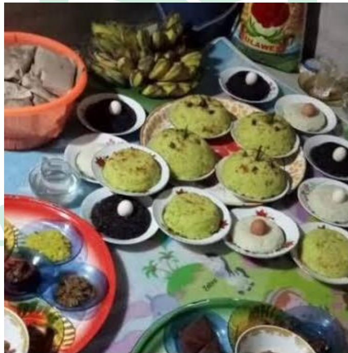
Gambar 1.2 sokko, telur rebus dan pisang