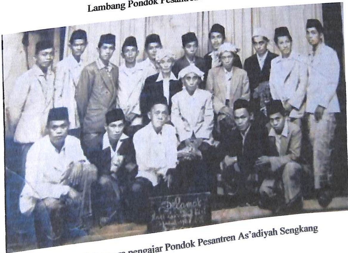
Santri-santri dan para pengajar Pondok Pesantren As'adiyah Sengkang