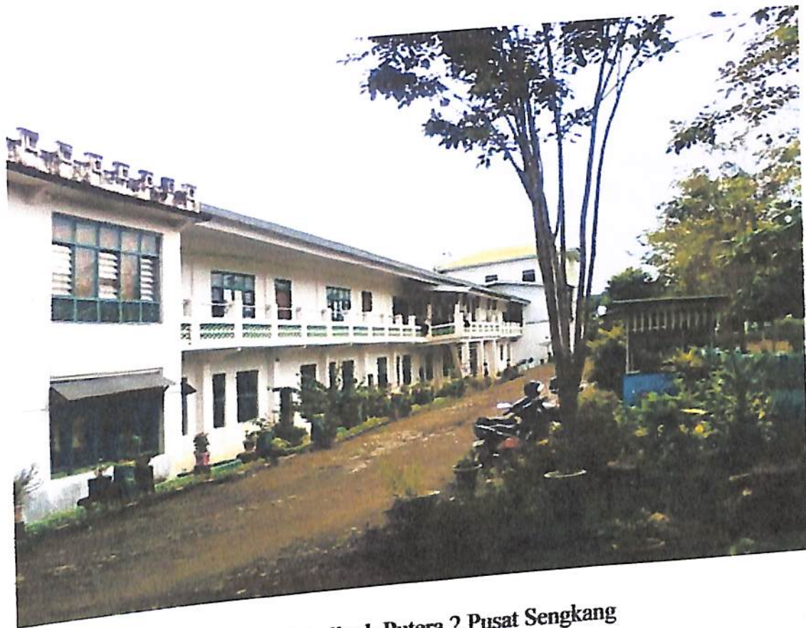
MTs. As'adiyah Putera 2 Pusat Sengkang