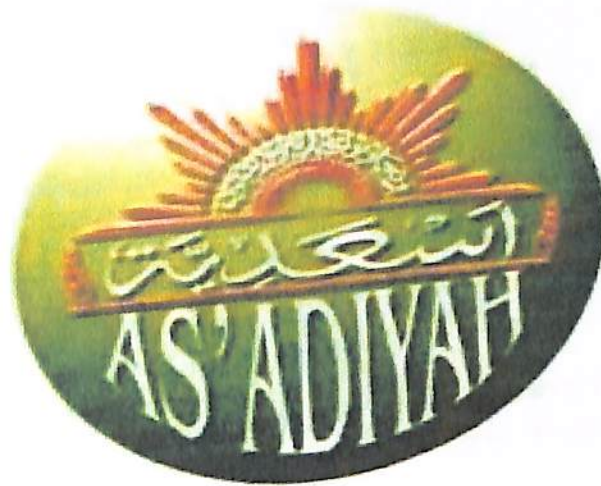
Lambang Pondok Pesantren As'adiyah Sengkang