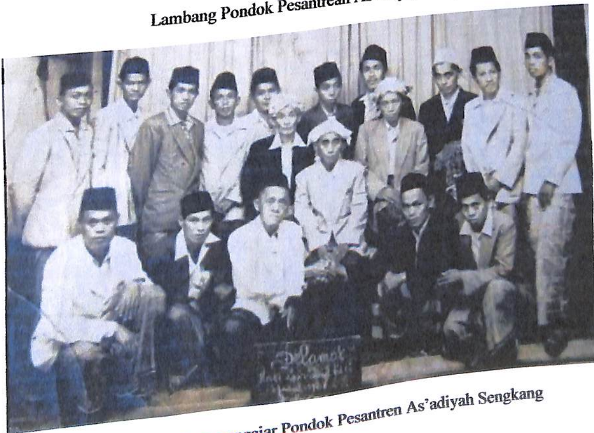
Santri-santri dan para pengajar Pondok Pesantren As'adiyah Sengkang