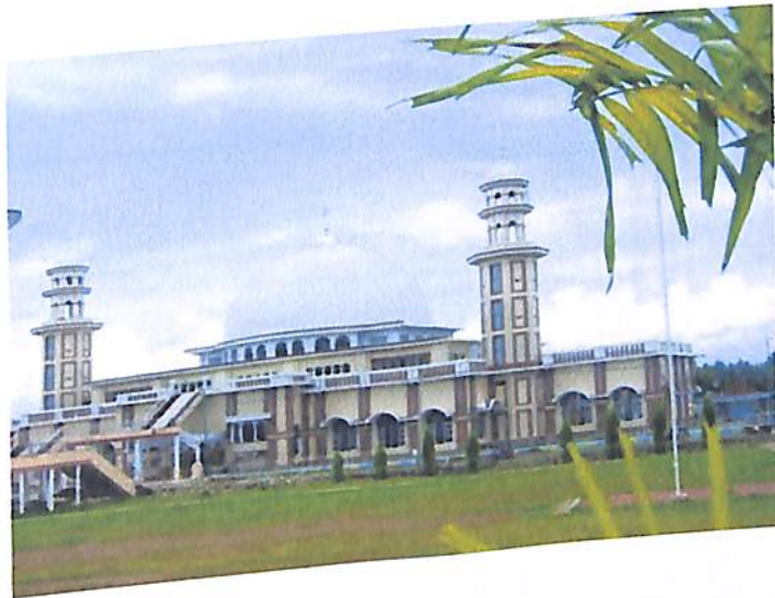
Masjid Jami Sengkang salah satu tempat yang digunakan para pengajar pada pengajian kitab di Pondok Pesantren As'adiyah Sengkang