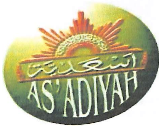
Lambang Pondok Pesantren As'adiyah Sengkang