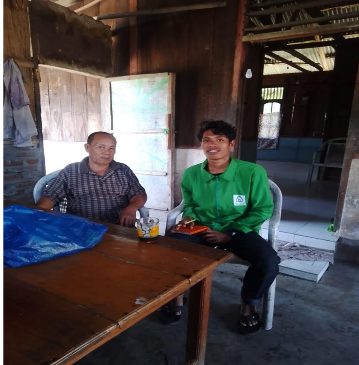
Gambar 9: Foto dengan Bapak KM, masyarakat setelah wawancara di Desa Duwanur, 15 Mei 2023