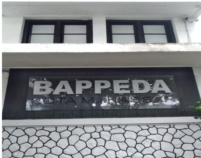
Gambar Kantor Bappeda Dari Depan