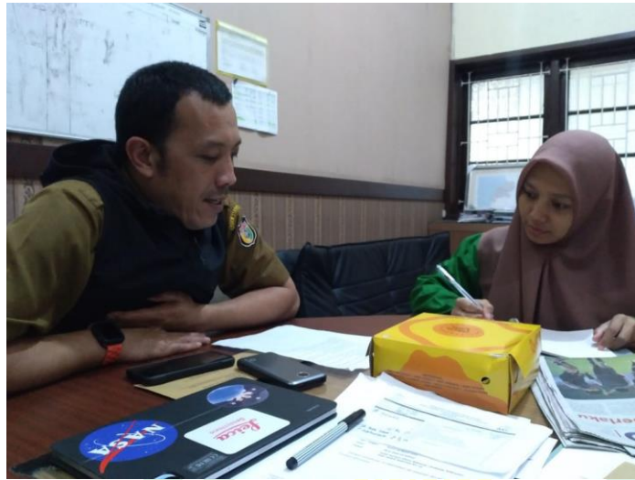
Wawancara bersama Kabid Infrastruktur dan Pengembangan Wilayah Bappeda Kota Makassar