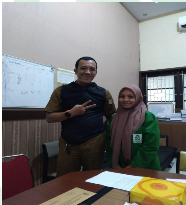
Foto bersama Kabid Infrastruktur dan Pengembangan Wilayah Bappeda Kota Makassar