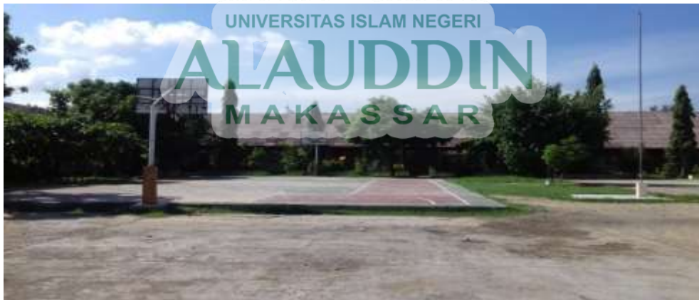
E. Lokasi Penelitian di Madrasah Aliyah Negeri 1 Kota Bima