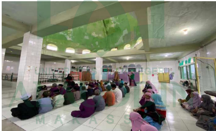
(Melaksanakan klasikal dzikir bersama setelah shalat ashar, membaca doa, ayat pilihan dan surah-surah pendek)