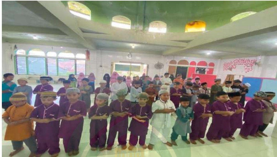
(Santri TPA Istiqamah sedang melangsungkan shalat ashar berjamaah dimasjid)