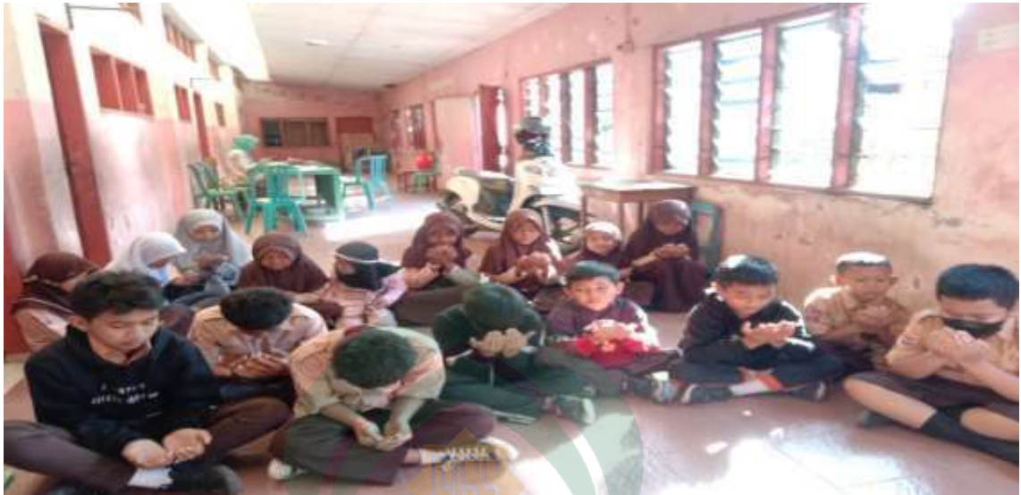
Wawancara Peserta Didik