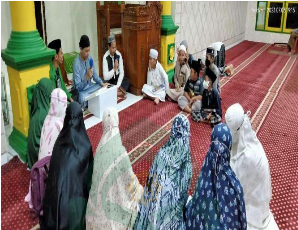
Arahan dari guru untuk santri dan santriwati tadarrus

UNIVERSITAS ISLAM NEGERI UNIVERSITAS ISLAM NEGERI MAKASSAR ALAUDDIN MAKASSAR