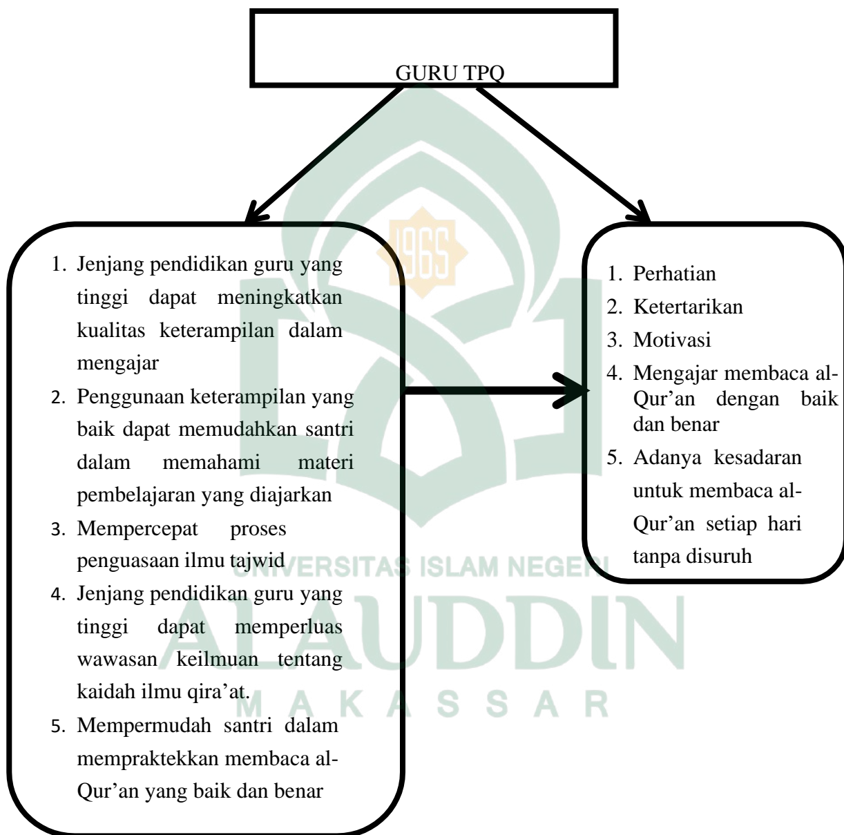
Tabel 2.1 Kerangka Pikir