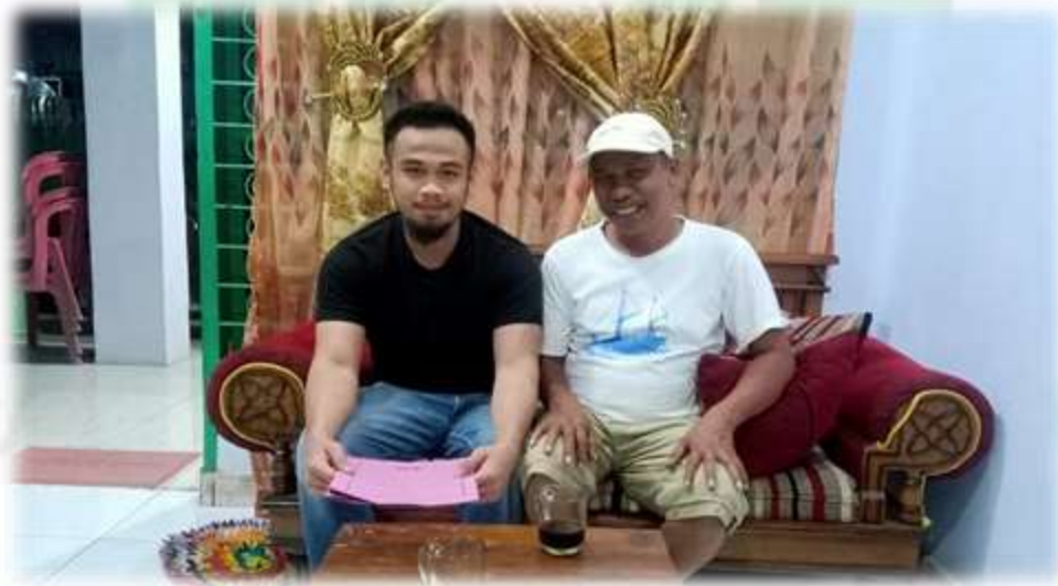
Wawancara dengan bapak Hanura selaku masyarakat kec. Gantarang kab. Bulukumba