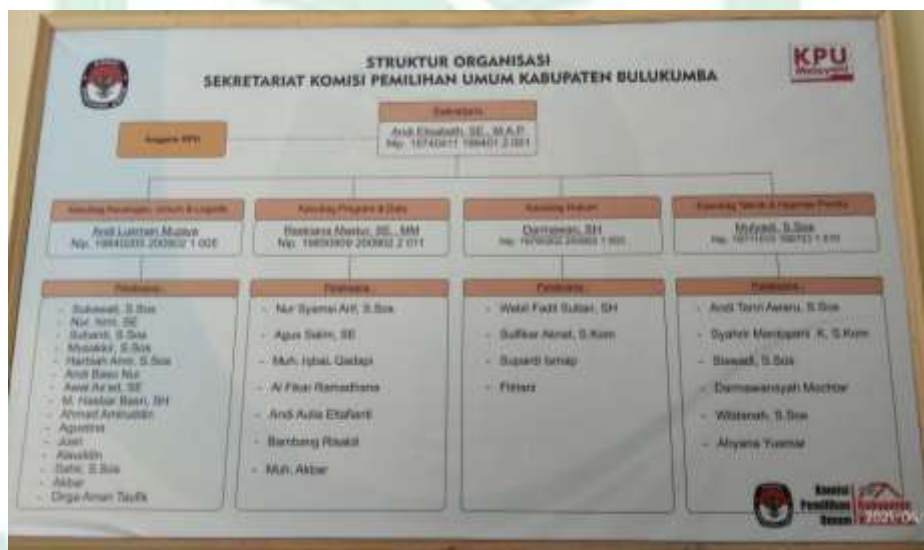
Struktur Organisasi Komisi Pemilihan Umum Kabupaten Bulukumba