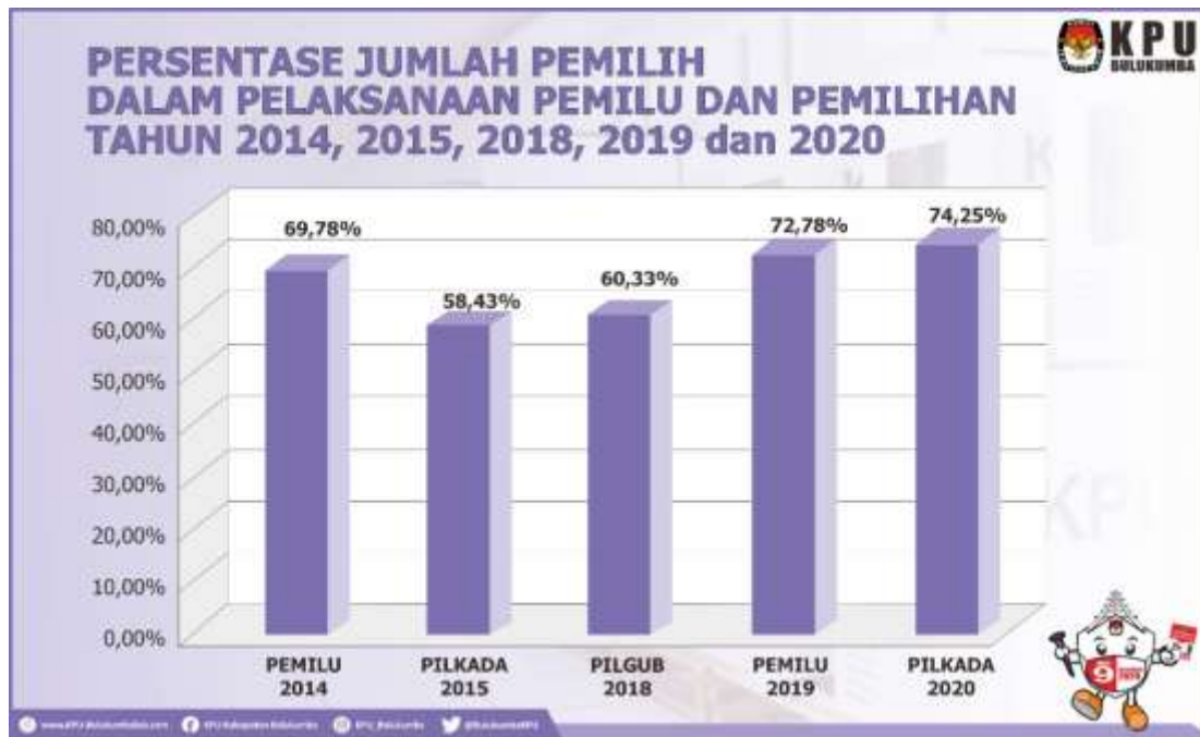
Persentase Jumlah Pemilih Dalam Pelaksanaan Pemilu Tahun 2014-2020