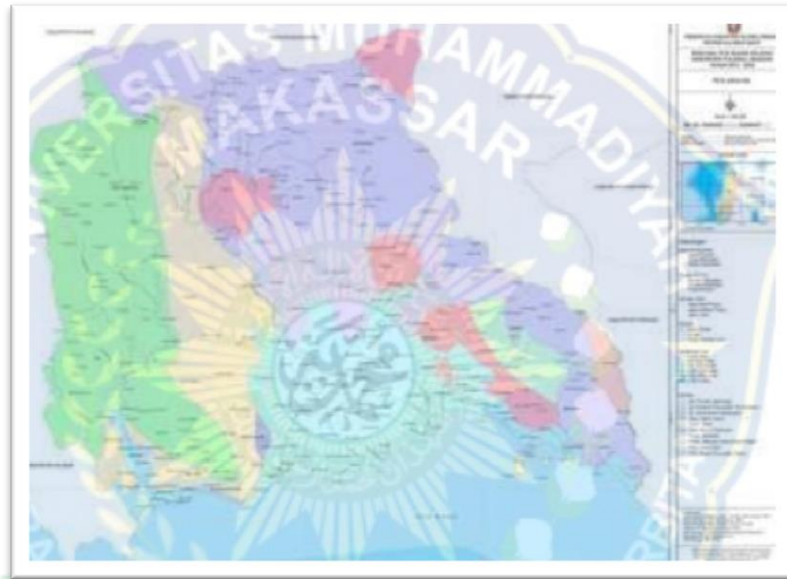
Gambar 4.2 Peta Geologi Kabupaten Polman

Berdasarkan peta geologi, Sulawesi skala 1:250.000 lembar Majene dan bagian barat lembar Palopo, Sulawesi (Puslitbang geologi, 1998) Kabupaten Polewali Mandar terdiri dari enam formasi batuan, yaitu; (Qa) ALUVIUM berupa endapan liat, pasir, dan kerikil; (Qpps) NAPAL PAMBAUANG berupa napal tufaan, serpih napalan, batupasir tufaan yang mengandung fosil foraminifera berumur pliosen; (Tmpi) BATUAN TEROBOSAN berupa granit, granodiorit, diorite, sienit dan dijumpai gabro berumur pliosen; (Tmvp) BATUAN GUNUNG API WALIMBONG berupa lava bersusunan basal sampai andesit, breksiandesitpiroksin, breksi andesittrakit berumur mio-pliosen; (Tmm) FORMASI MANDAR berupa batupasir, batulanau, dan serpih berumur miosen akhir, (Tmmpm) FORMASI MAPI berupa batupasir tufaan, batulanau, batulempung, dan batugamping berumur miosen tenggan-pliosen; (Tmav) BATUAN GUNUNG API ADANG berupa tuf, lava dan breksi gunung api