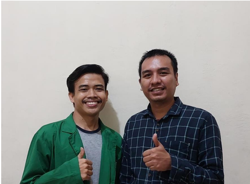
(Wawancara bersama Asy'ari selaku salah satu Tokoh Masyarakat)

UNIVERSITAS ISLAM NEGERI ALAUDDIN M A K A S S A R