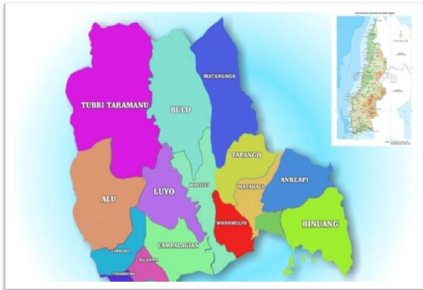
Gambar 4.1 Peta Administrasi Kabupaten Polman

Kabupaten Polewali Mandar merupakan salah satu dari enam Kabupaten yang berada di wilayah Provinsi Sulawesi Barat dengan luas darat 2.094,18 Km 2 dan luas wilayah laut 460 Km 2 , serta panjang garis pantai 94,12 Km 2 . Berdasarkan letak geografis, Kabupaten Polewali Mandar berbatasan dengan: Sebelah Utara berbatasan dengan Kabupaten Mamasa, sebelah Selatan berbatasan dengan selat Makassar, sebelah Timur berbatasan dengan Kabupaten Pinrang dan sebelah Barat berbatasan dengan Kabupaten Majene.